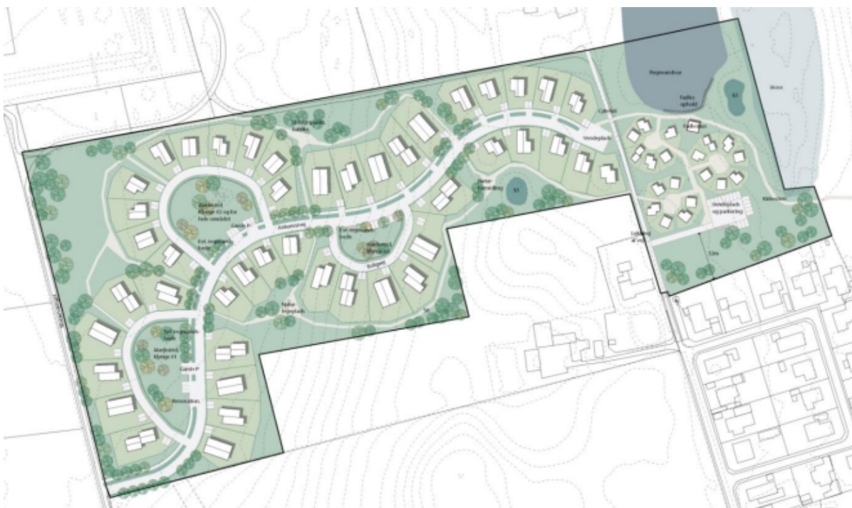
Skitse over bebyggelsesplan for parcelhuse og tiny houses. Grafik: Frederikssund Kommune.

Et forslag til ny lokalplan giver mulighed for opførelse af 45 parcelhuse og op til 20 tiny-houses i den sydlige del af Vinge. Planen er nu i høring i otte uger.