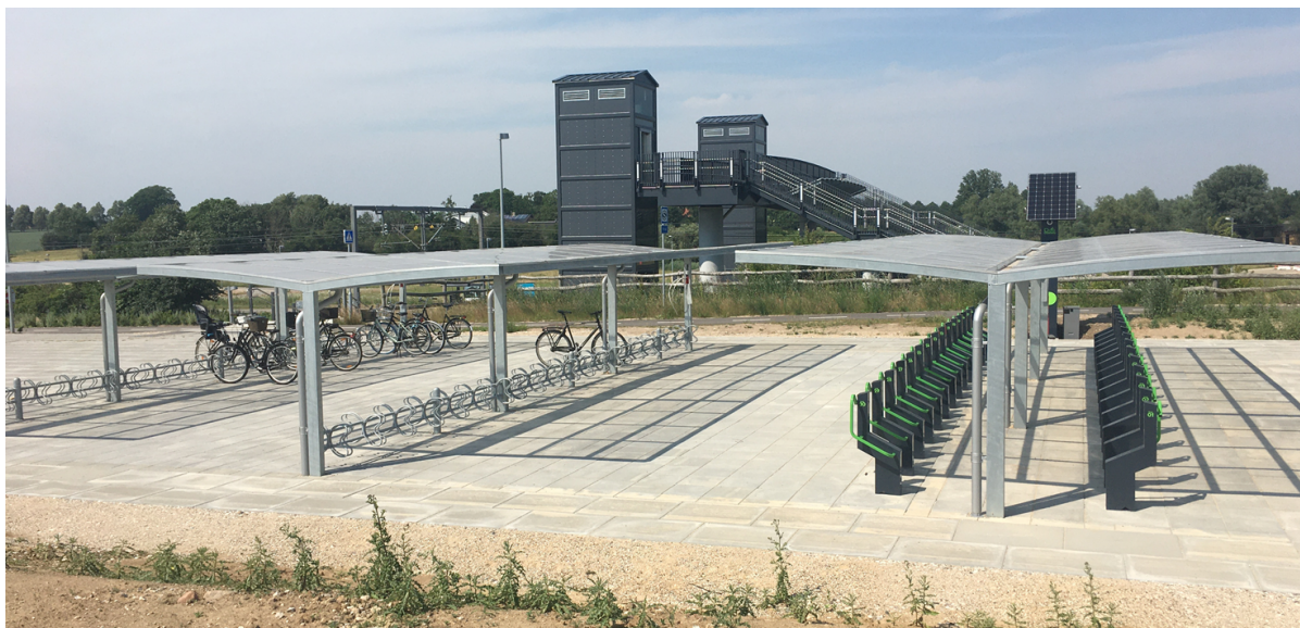
Ny overdækket cykelparkering ved Vinge Station.