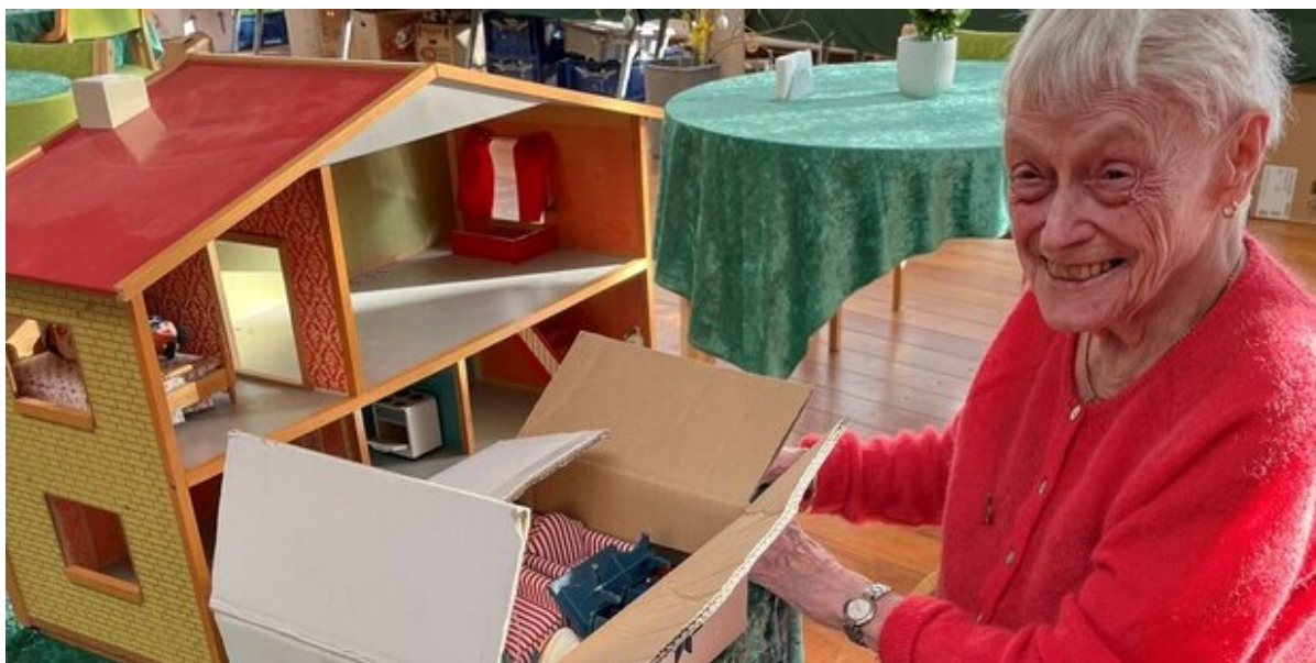
Kvinde arbejder med et dukkehus.

Er du god til at bage vafler eller til at lave noget kreativt? Er du glad for gymnastik eller banko? Så er du måske en af de nye frivillige som omsorgscentrene Tolleruphøj og Solgården søger lige nu til en masse spændende aktiviteter sammen med beboerne.