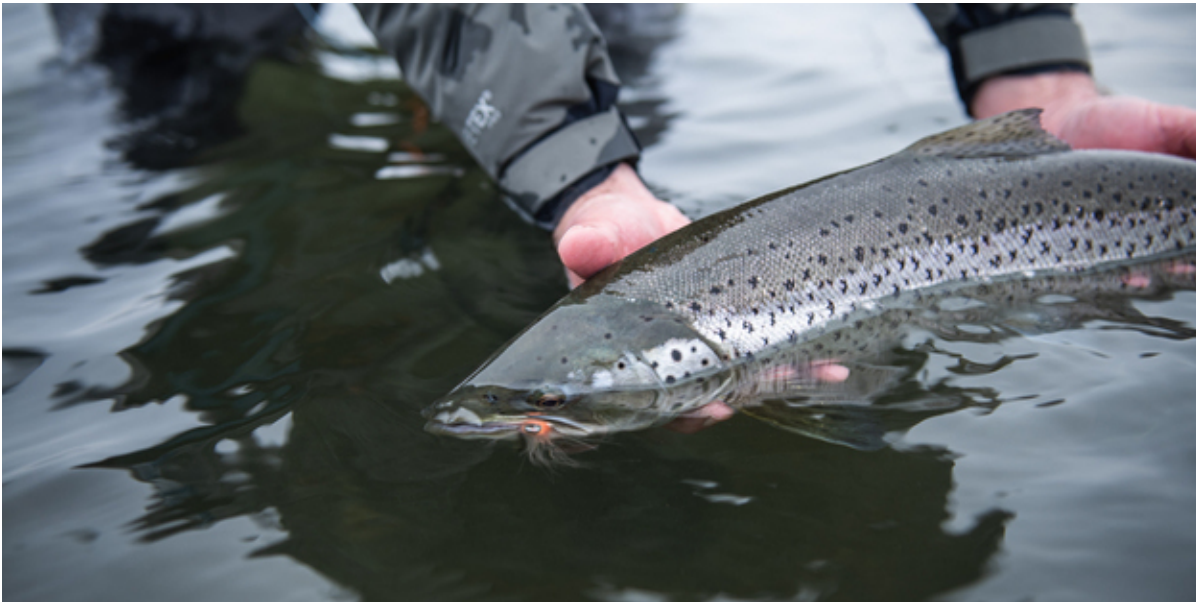
Ørred holdes i hænderne i vandoverfladen.

Fishing Zealand har taget initiativ til et nyt koncept, nemlig en hyggelig fiskeweekend, og inviterer således til "Shelter & Sølvtoj" i Frederikssund kommune.