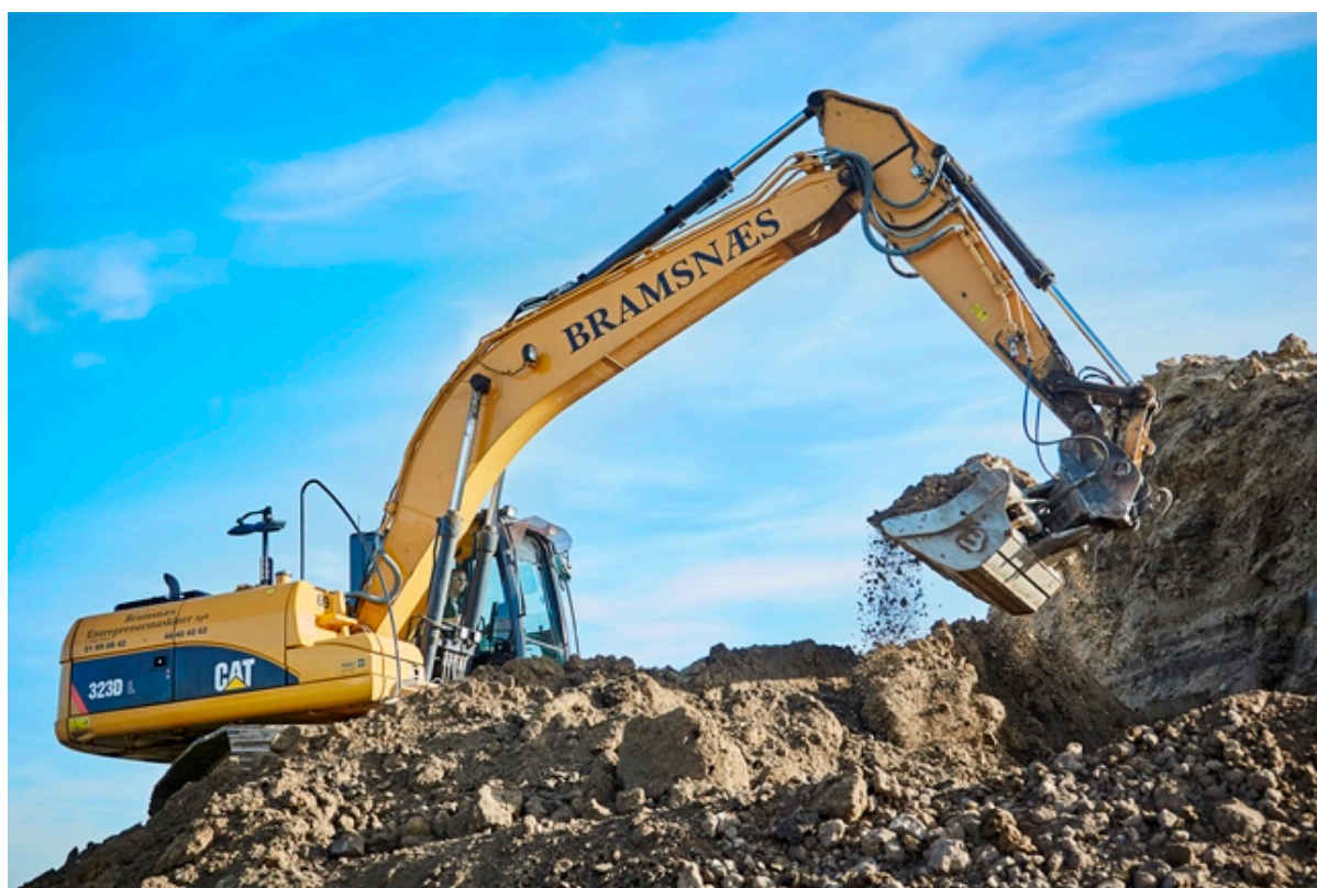
Gravemaskine flytter jord.

På en inspirationsdag hos Erhvervshus Hovedstaden kan du få inspiration til, hvordan et samarbejde med en studerende eller forsker kan give netop din virksomhed værdi og nye perspektiver på rekruttering og udvikling.