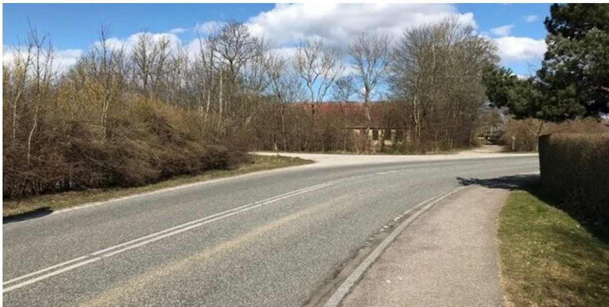
Jordhøjvej, Slangerup.

I forbindelse med byggemodning af et areal i Slangerup skal der etableres en dobbeltrettet sti langs Jordhøjvej. Beplantningen ind mod boldbanerne skal derfor ryddes, men den bliver etableret igen senere på året.