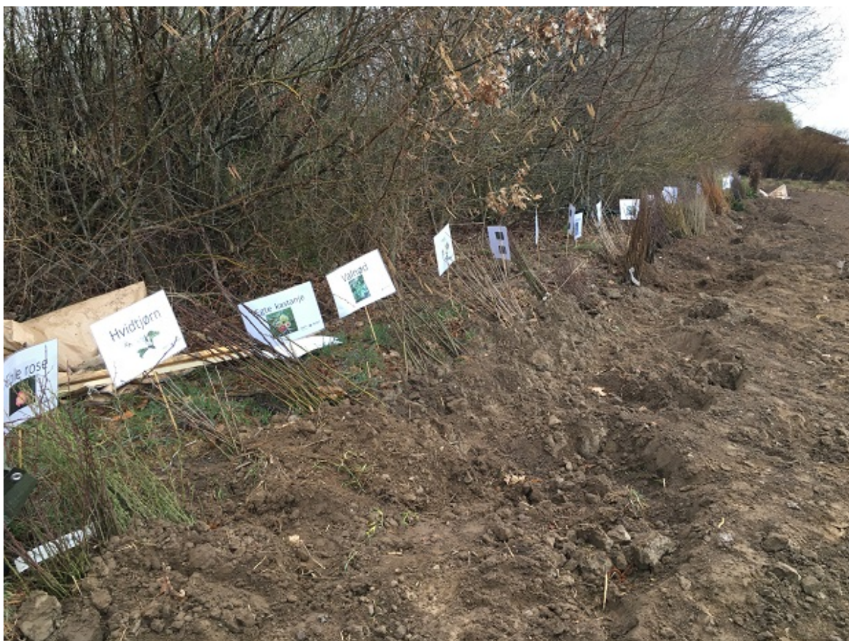
Skud til træer og buske på en lang række.