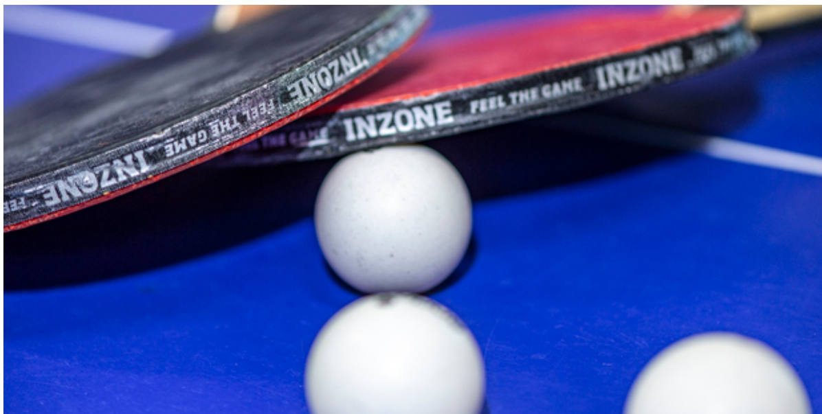
Bordtennisbat og bolde.

Folkeoplysningsudvalget har afsat yderligere 200.000 kr. i 2022 til Frederikssund Kommunes Fritidspasordning. Formålet er at sikre penge nok til kontingentstøtte, både til de børn og unge som bor i Frederikssund Kommune, men også til de børn og unge, som kommer til Frederikssund Kommune som flygtninge.