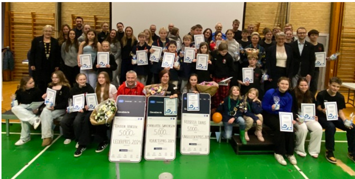
Alle prisvindere og modtagere af anerkendelser.