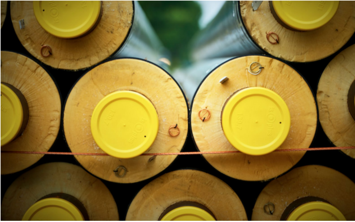
En stak fjernvarmerør.