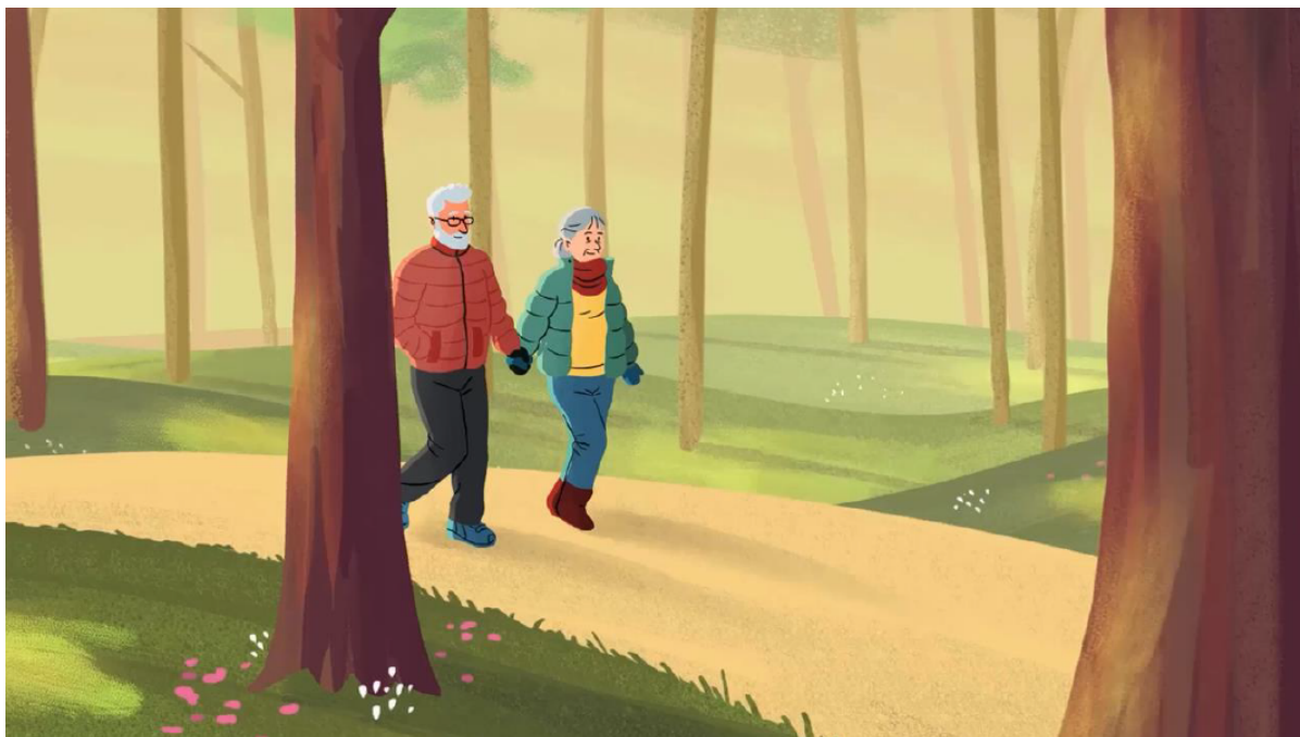
Tegning af ældre ægtepar, der går tur i skoven. Grafik KL og Danske Regioner.

Borgere i Danmark har fra den 15. januar fået mulighed for at fravælge forsøg på genoplivning i tilfælde af et hjertestop. Muligheden gælder for dig, der er over 60 år.