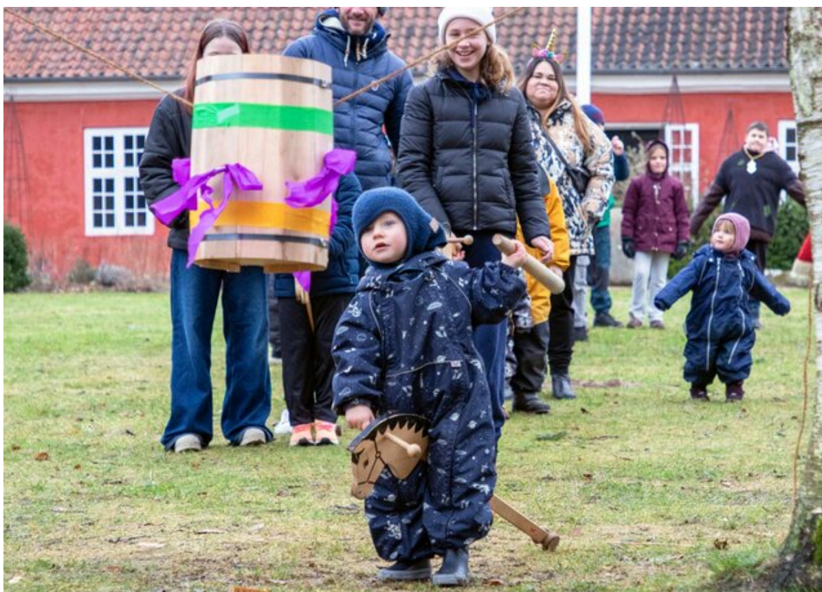
Der bliver slået katten af tøndens på Museum Færggården.

VisitFjordlandet hjælper dig ud i ferielandet med en stor vinterferieguide.