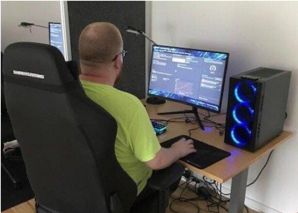
Person spiller på en gamingcomputer.

Onsdag den 7. september kl. 17.00 bliver et nyt mødested for unge officielt åbnet på Parkvej 4-6 i Jægerspris.