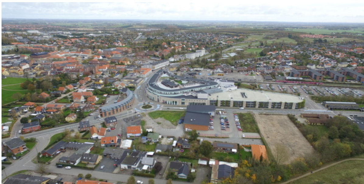
Frederikssund bymidte set fra luften.