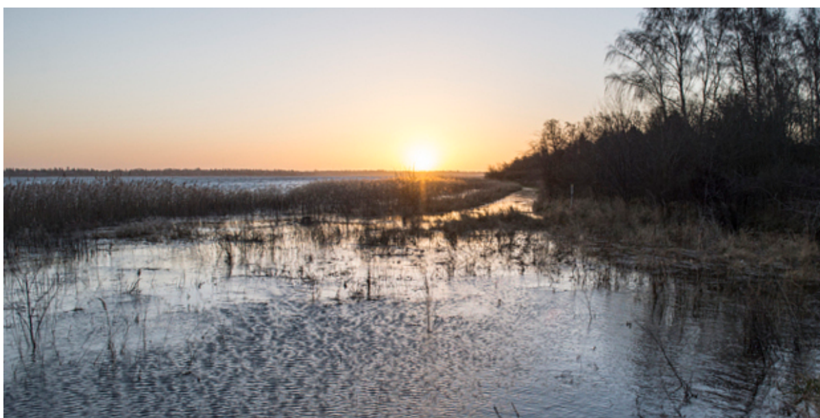
Oversvømmelse ved Hyllingeriis.

Statens pulje til kystbeskyttelse har givet tilsagn om næsten 2,1 mio. kr. til et kystbeskyttelsesprojekt ved Hyllingeriis. I alt er 150 mio. kr. delt ud på landsplan til kystbeskyttelse.