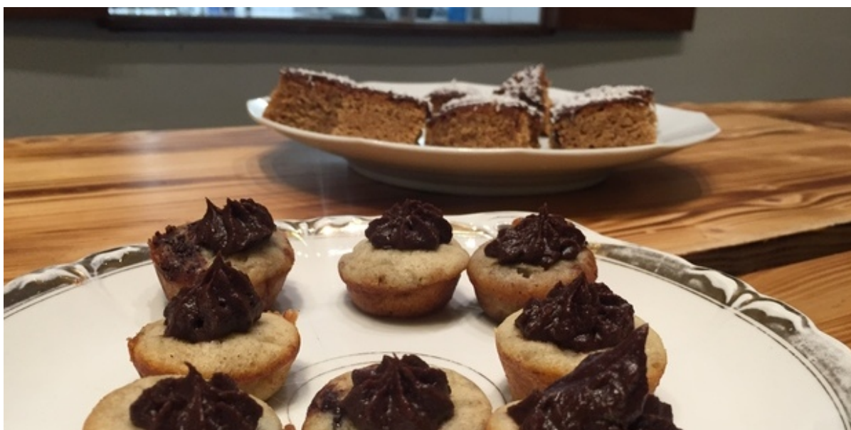
To fade med kager produceret af skolens elever.

FGU Nordsjællands afdeling i Skibby holdt forleden åbent hus for unge uddannelsessøgende, for at vise hvor mange muligheder institutionen kan tilbyde.