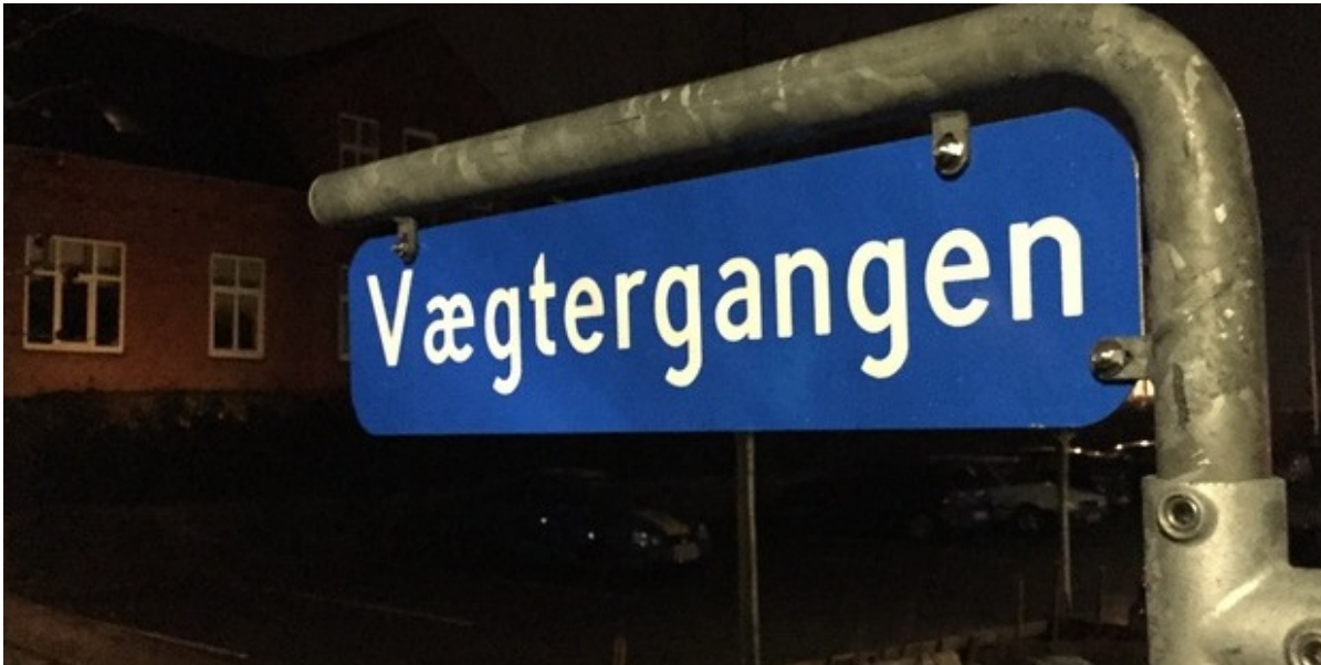
Det nye skilt med vejnavnet Vægtergangen.

Onsdag den 4. januar fik Slangstrup Vægterkorps et længe næret ønske opfyldt. Et vejstykke ved Slangstrup Administrationscenter blev navngivet Vægtergangen.