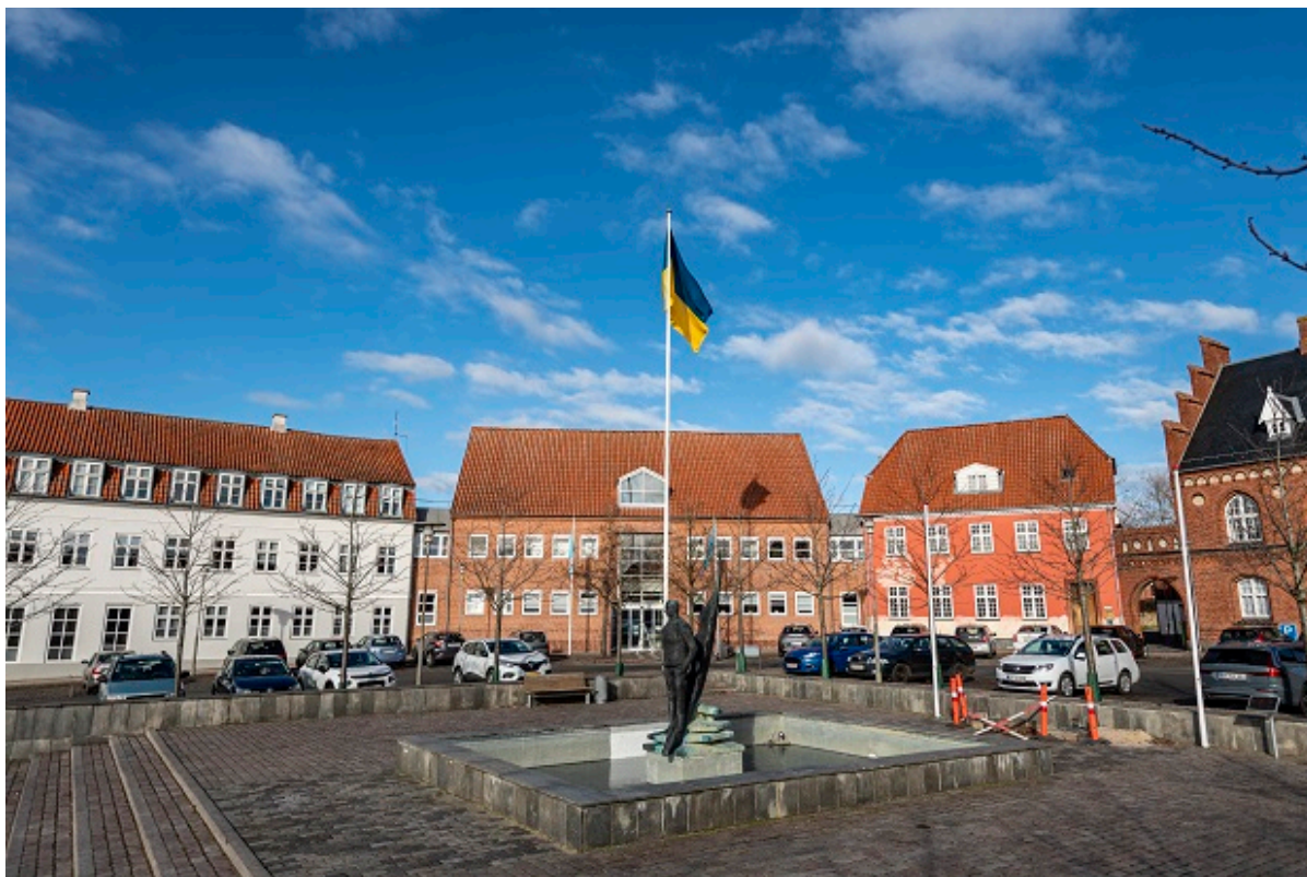
Ukrainsk flag hejst foran Frederikssund Rådhus.