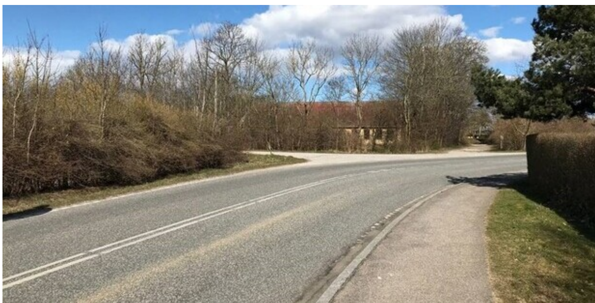
Jordhøjvej, Slangerup.

I forbindelse med byggemodning af et areal i Slangerup skal der etableres en dobbeltrettet sti langs Jordhøjvej. Beplantningen ind mod boldbanerne skal derfor ryddes, men den bliver etableret igen senere på året.