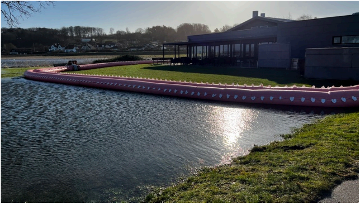
Watertuben ved Kignæshallen har holdt vandet væk fra hallen.