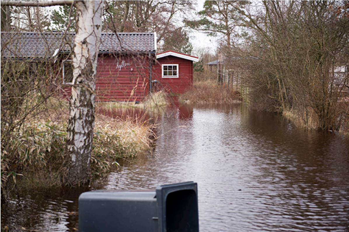
Goldbjergvej i Kulhuse under stormen Egon i januar 2015.

Prognoserne fra DMI varsler lørdag formiddag stadig meget høj vandstand i begge fjorde, hvorfor en række ejendomme forventes oversvømmet.