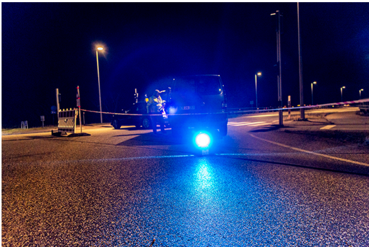
Kronprins Frederiks Bro er spærret.