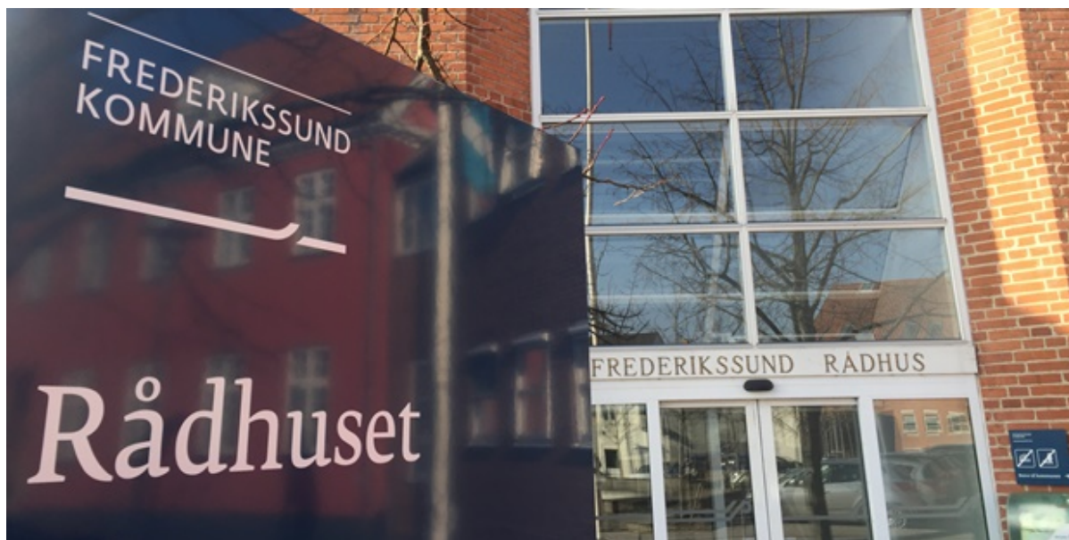
Rådhusets hovedindgang.

Fra lørdag kl. 12 til mandag morgen vil det være muligt at komme i kontakt med Frederikssund Kommunes callcenter vedrørende akutte forhold om storm og højvande.