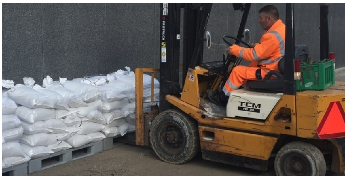
Sandsække løftes af gaffeltruck.

Lørdag leverer Frederikssund Kommune de sidste sandsække ud fra lageret.