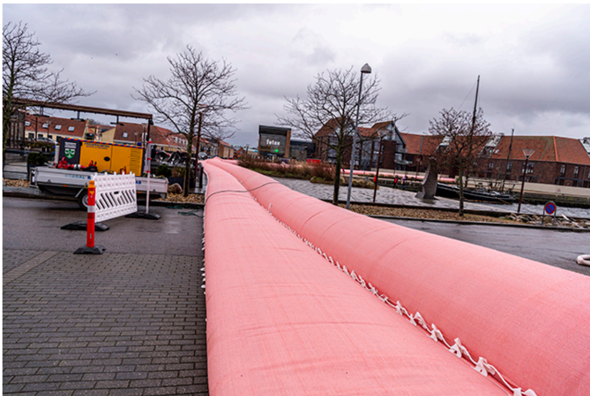
Watertubes på havnen i Frederikssund.