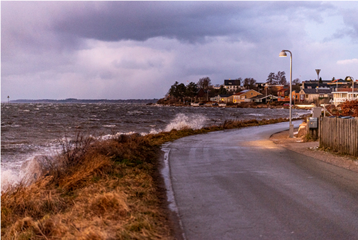
Strandvej med vandet piskende ind over.

Døgnplejen har været i kontakt med alle brugere af døgnplejen i de områder, der er i risiko for at blive oversvømmet. Er dit hus i risikozonen, og har du ingen steder at overnatte, kan du kontakte kommunen.