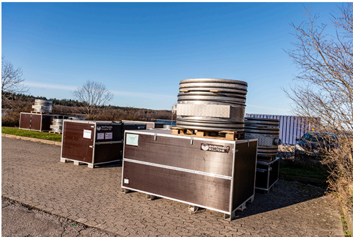
De første watertubes er ankommet.