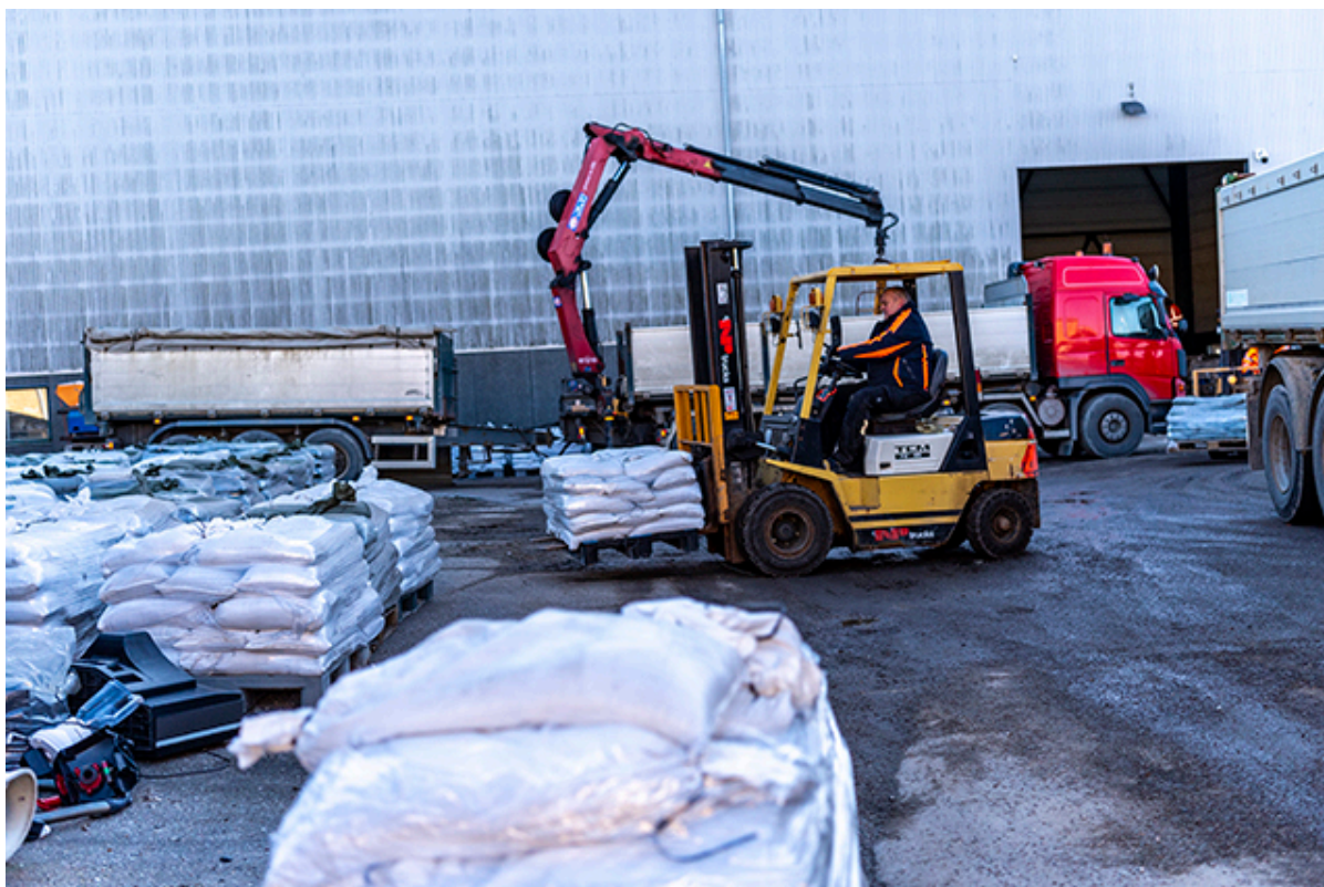
Hos Vej og Park knokles der på med sandsækkene.

Kommunens watertubes er begyndt at ankomme fra depotet i Kalundborg, og hos Vej og Park knokles der på med at få kørt sandsække ud.