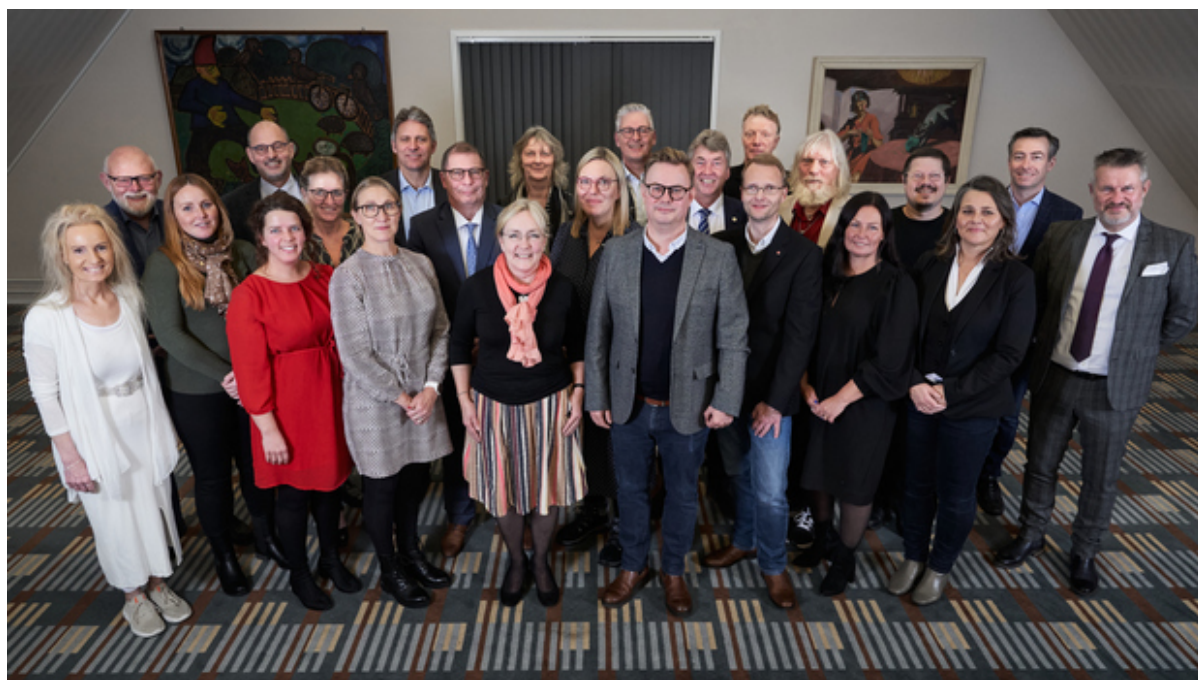
Gruppefoto af de 23 medlemmer af Frederikssund Byråd 2022 - 2025.

Efter de konstituerende møder i de stående fagudvalg under Byrådet er der nu sat navne på udvalgenes nye formænd og næstformænd.