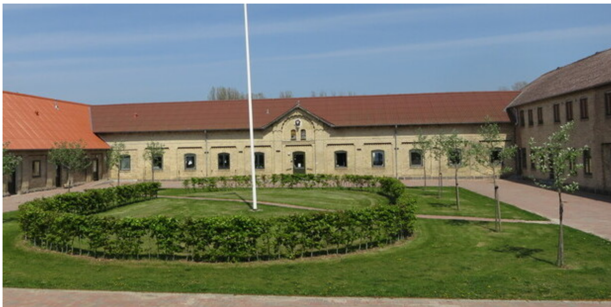
Gårdspladsen på højagergaard.

Så står foråret og sommeren for døren, og det er tid til årets forårsmarked på Højagergaard. I år foregår det i weekenden den 7. og 8. maj med salg af planter og produkter fra Højagergaards produktion.