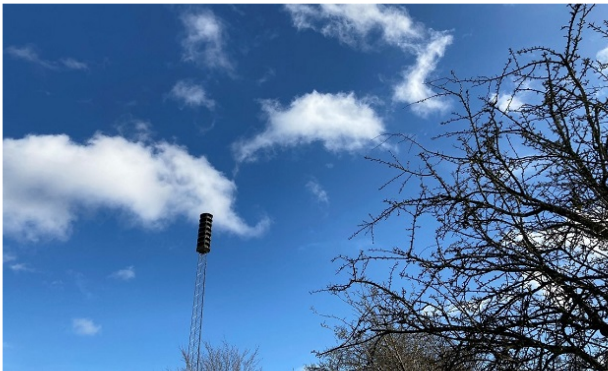
Varslings sirene.