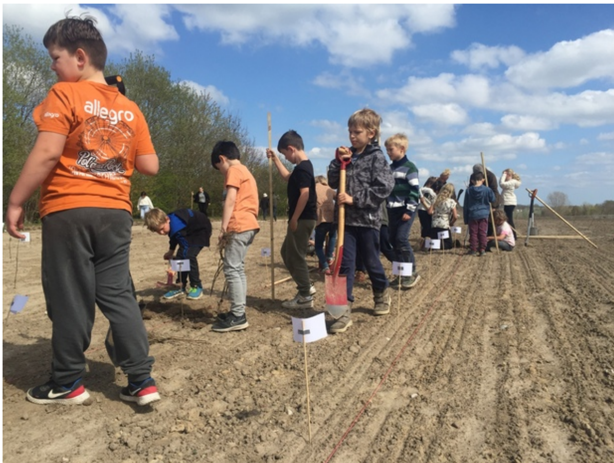
Børnene fra SFO'en på Slangerup Skole Afd. Lindegård gik til den med spaderne. Foto:

Fredag den 29. april var der inviteret til plantning af en ny skov ved Slangerup. Og mange tog imod invitationen til at være med til at plante de første af i alt 130.000 træer, der plantes dette forår i den nye skov.