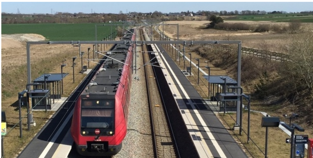
S-tog holder på Vinge Station.