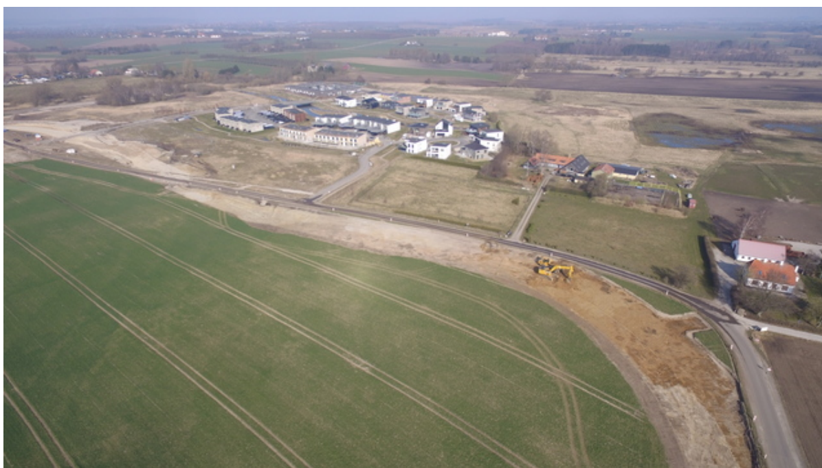
Vejarbejde på Dalvejen.

For at færdiggøre det sidste arbejde på Dalvejen i Vinge bliver vejen lukket for trafik etapevis i perioden fra den 9. maj til den 9. juli. I samme periode ændrer bus 312 sin rute.