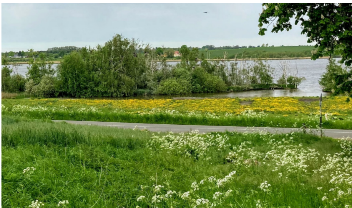
Grønt område med mælkebøtter ud til fjorden.

Byrådet har netop vedtaget en ny naturstrategi, der sætter retning for, hvordan kommunen skal forvalte naturen. Herunder blandt andet hvordan der skal arbejdes for at sikre biodiversiteten, beskytter truede dyr og planter samt arbejde med skovrejsning i kommunens landområder.