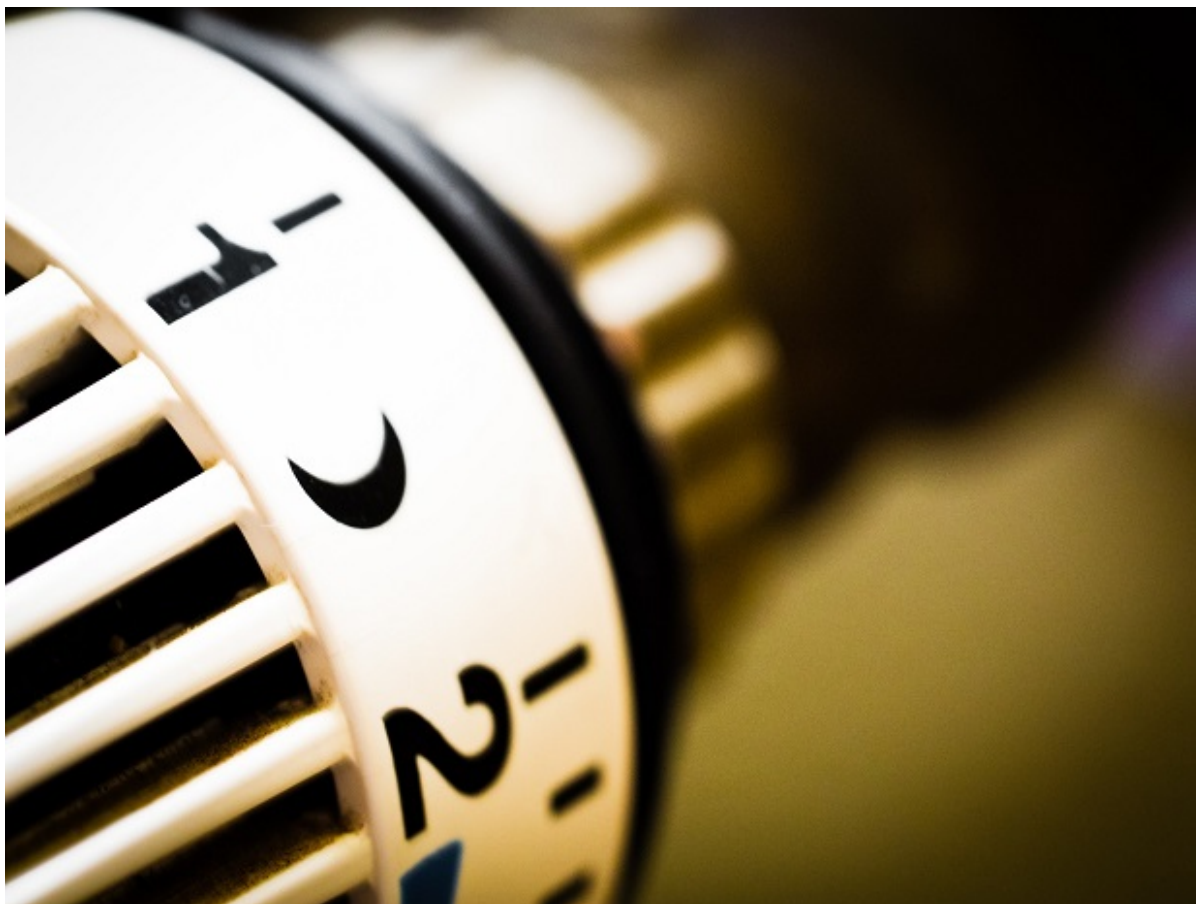
Termostat på radiator.

Folketinget har vedtaget en økonomisk hjælpepakke til borgere, der har svært ved at betale de stigende el- og varmeudgifter. Er du i gruppen, der kan få økonomisk hjælp, vil du automatisk få udbetalt pengene i august eller september.