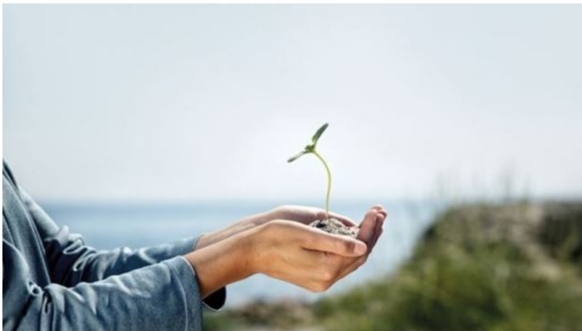
Hænder holder en spirende plante.