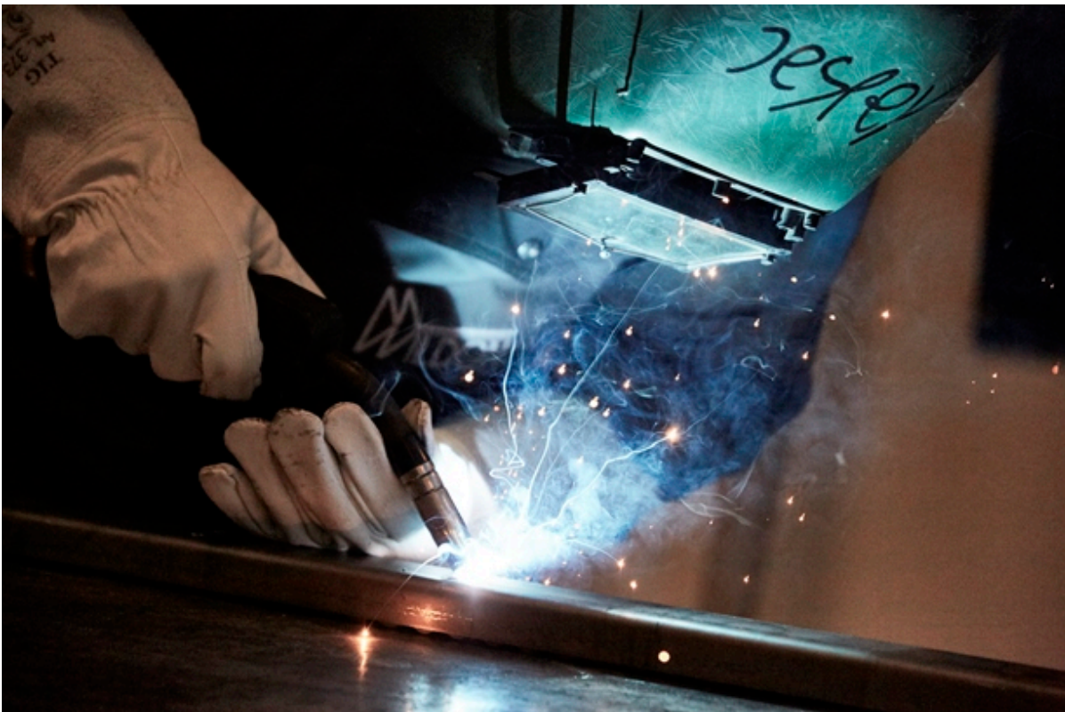
Smed svejser et stykke stål.

I den kommende tid er der en række ansøgningsrunder for virksomheder, der ønsker at styrke den grønne omstilling og tiltrække kvalificeret arbejdskraft samt til investeringsstøtteordningen.