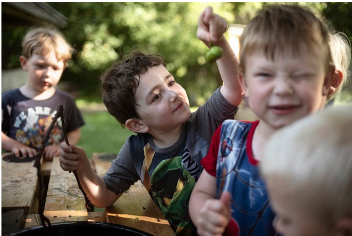
Børn leger udendørs på en varm dag.

En ny organisering af dagtilbudsområdet skal give styrket lokal ledelse og faglighed i de enkelte børnehuse i Frederikssund Kommune.