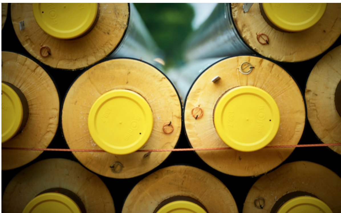
En stak fjernvarmerør.

Vestforbrænding har nu indsendt et fjernvarmeprojekt til Frederikssund Kommune om at kunne fjernvarmeforsyne alle områder i Frederikssund by og Græse Bakkeby, som i dag ikke har fjernvarme. Vestforbrænding vurderer, at projektet kan realiseres i årene 2026 – 2030. Projektet skal nu behandles politisk.