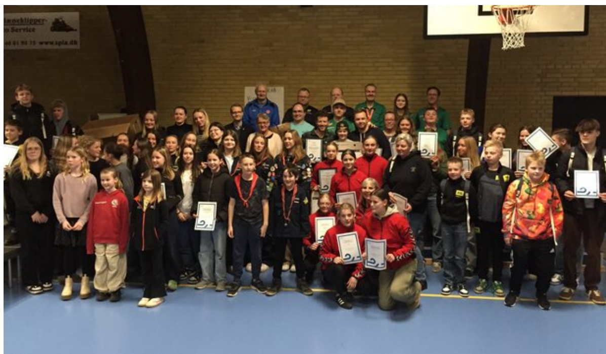
Modtagere af priser og anerkendelser ved prisfesten 2024.

Folkeoplysningsudvalget har fundet seks nominerede til årets Unge Lederpris, Lederpris og Idrætspris. Vinderne bliver afsløret ved prisfesten 25. februar 2025.