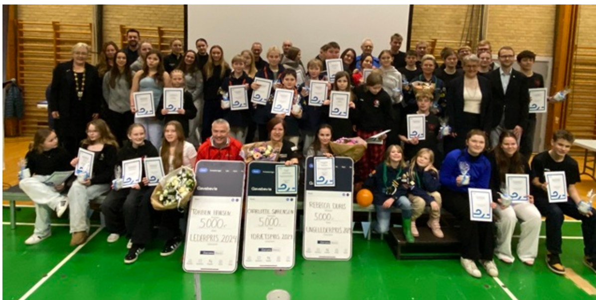
Alle prisvindere og modtagere af anerkendelser.

Tre priser og 108 anerkendelser blev uddelt til foreningslivet, da Folkeoplysningsudvalget uddelte årets priser og anerkendelser til foreningsaktive og idrætsudøvere fra hele Frederikssund Kommune.