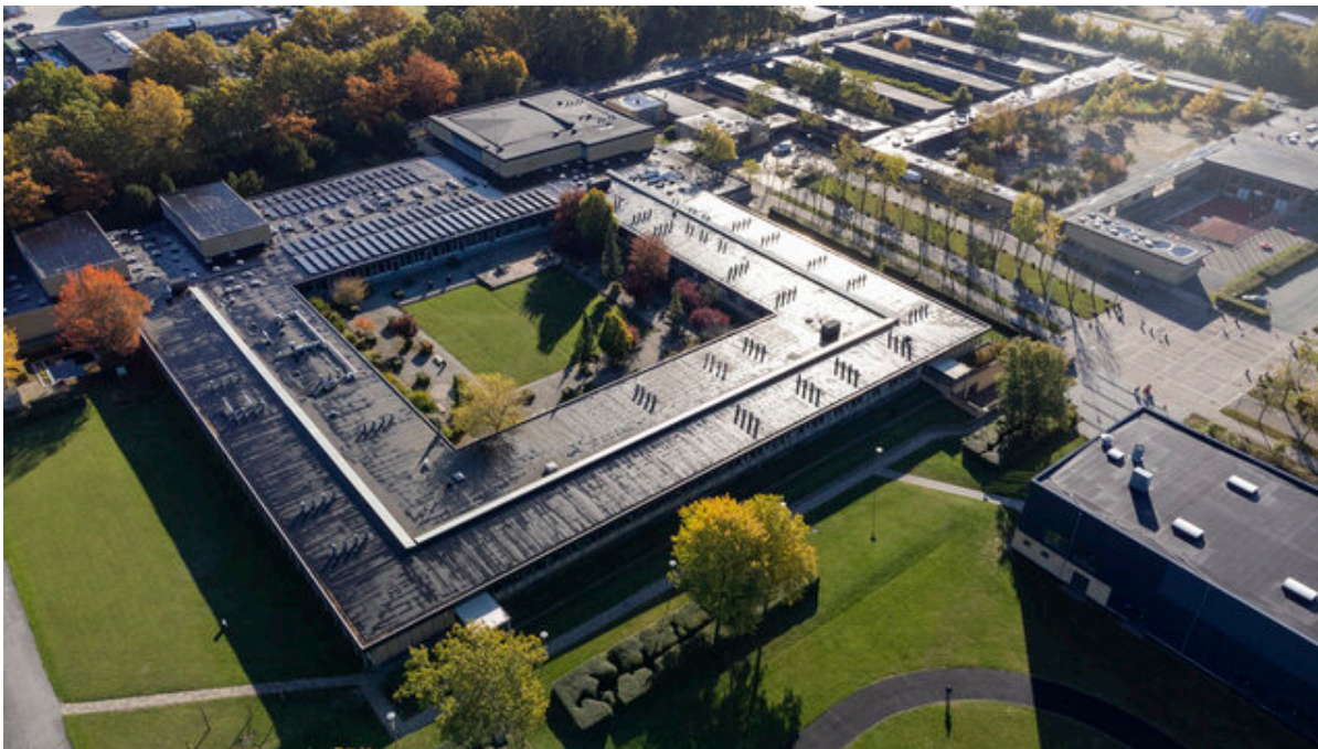
Campus Frederikssund.

Den nyligt indgåede aftale i Folketinget om en reform af de gymnasiale uddannelser bliver taget imod med kyshånd på Campus Frederikssund. Uddannelsesinstitutioner her samt Frederikssund Kommune håber på, at reformen kan være løftestang for ét samlet fælles Campus i Frederikssund med et stort og varieret uddannelsesstilbud til unge mennesker.