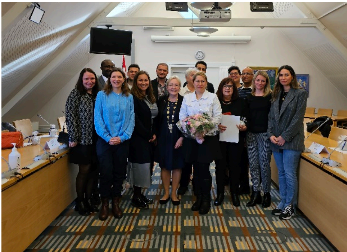
Borgmester Tina Tving Stauning sammen med de 14 nye statsborgere.

I april 2024 kunne 14 borgere fra mange forskellige lande trykke borgmester Tina Tving Stauning i hånden og glæde sig over, at de nu kan kalde sig danske statsborgere.