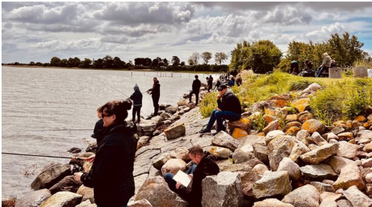
Mennesker står og fisker.

Nu er der mulighed for at komme på fisketur med en erfaren guide på Tandstumpen i Frederikssund Kommune søndag den 12. maj.