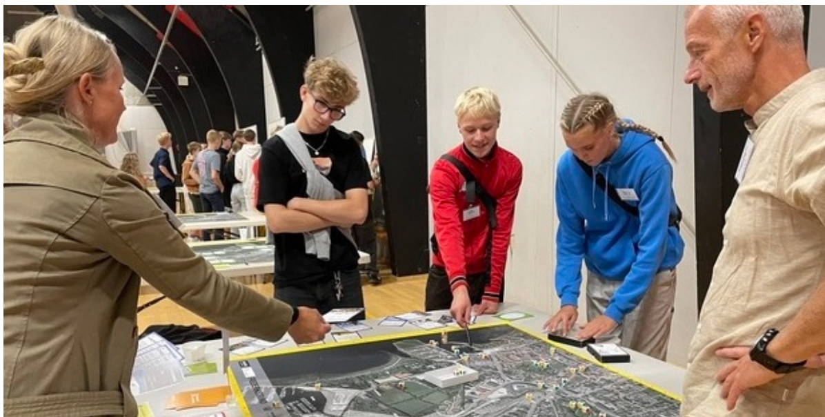
Fire personer står om et bord og kigger på et kort over Frederikssund midtby.

Gennem hele sommeren har borgerne i Frederikssund Kommune kunnet bidrage med ideer til kystbeskyttelse af Frederikssund midtby. Fra den 10. oktober bliver alle de mange gode ideer og input udstillet på havnen i Frederikssund.