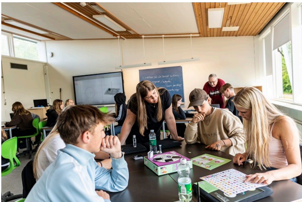
Elever til undervisning.