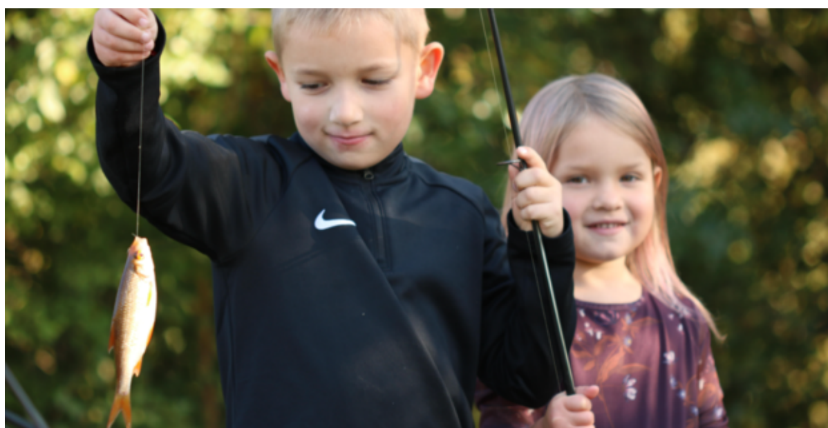
Dreng og pige med fiskestang og fanget fisk.

For børnefamilier er skolernes efterårsferie en oplagt mulighed, for at opleve naturens "efterårsmagi" på nærmeste hold ved Grønlien Sø – med en fiskestang i hånden.