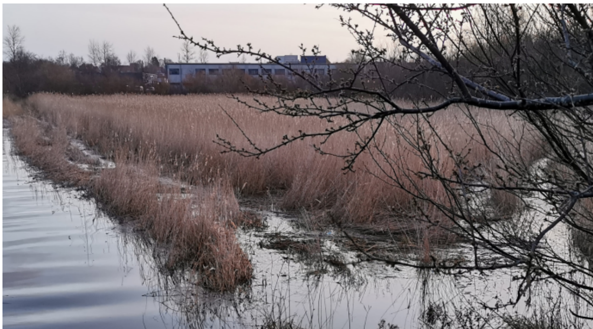
Oversvømmet rørskov ved vintertid.