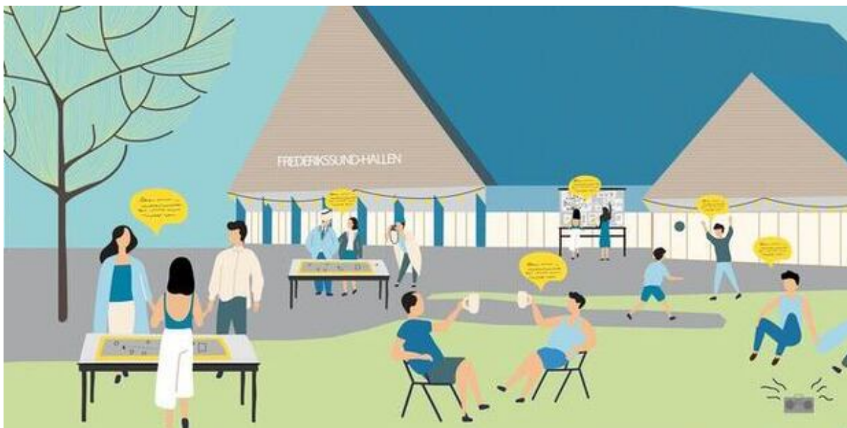
Illustration af borgere, der deltager i workshop, Frederikssund Kommune.

Lørdag den 10. september inviterer Frederikssund Kommune til workshop om kystbeskyttelse af Frederikssund midtby. Her samler vi alle gode ideer til det videre arbejde med kystsikring.