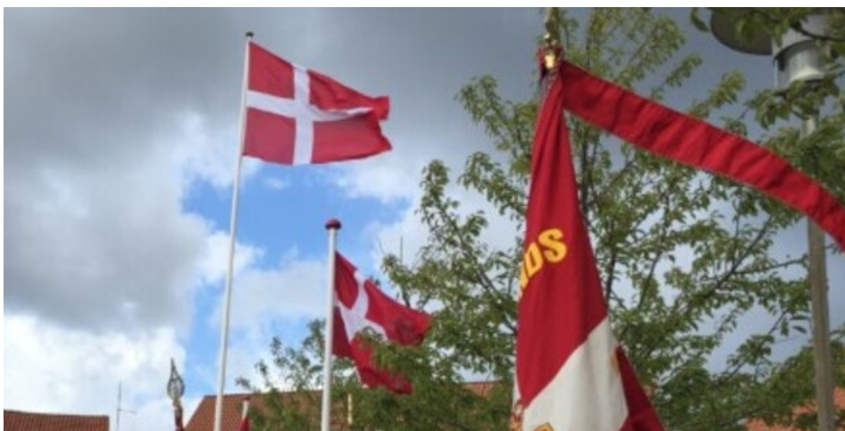
Dannebrog vajer i vinden på Torvet i Frederikssund.

Mandag den 5. september markerer Frederikssund Kommune den nationale flagdag for Danmarks udsendte. Markeringen foregår på Torvet i Frederikssund kl. 8.00.