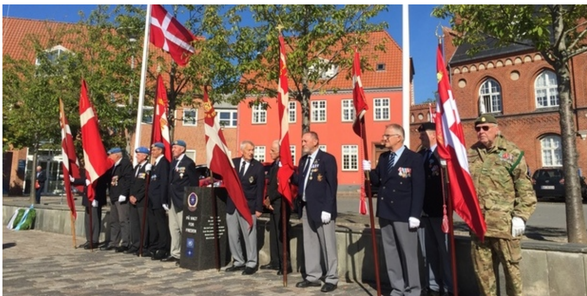
Æresgarden trak op ved flagdagen i 2021.