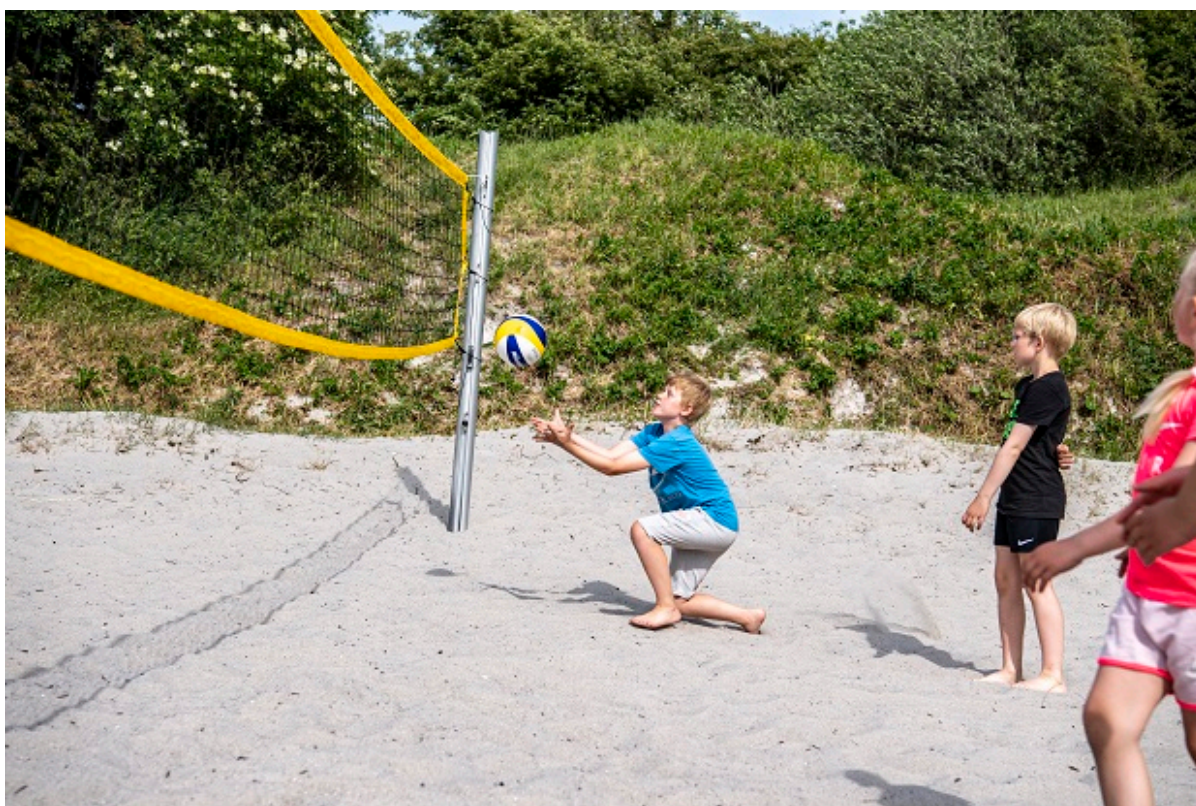
Børn spiller beachvolley.

Hæftet Aktiv Fritid er udkommet og giver et overblik over mange af de fritidstilbud, der er at finde i Frederikssund Kommune – det gælder alt fra klatring og håndbold til sang, kunst, spejder og meget mere.