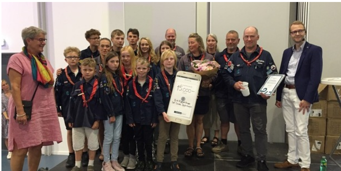
Erik Ejegod gruppe, det danske spejderkorps modtog årets Fritidspris.