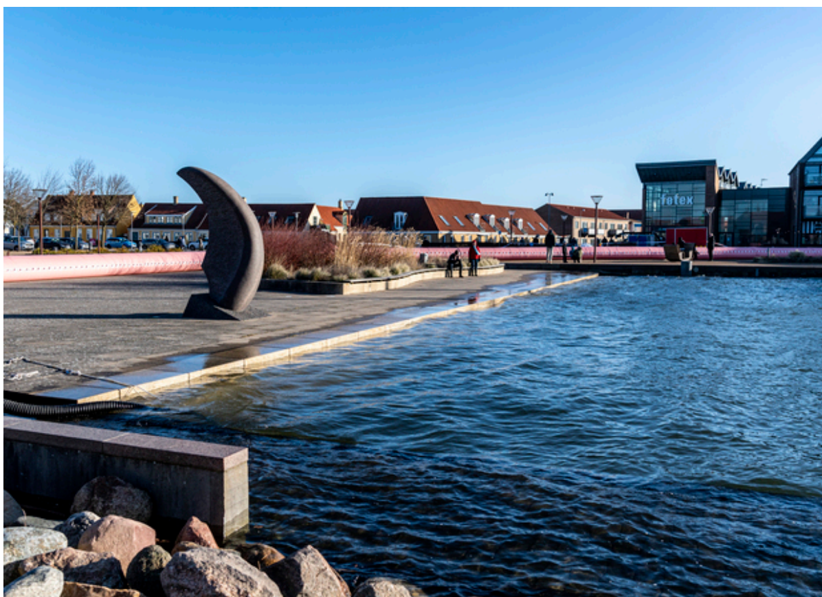
Frederikssund Havn under stormfloden Malik i januar 2022.

Nærhed til hav og fjord er en stor kvalitet i Frederikssund Kommune, hvor ingen borgere har længere end 15 km fra hoveddøren til nærmeste vandkant. Men havet giver også udfordringer. Den globale opvarmning betyder, at havniveauet stiger og udfordrer kystnære byer.