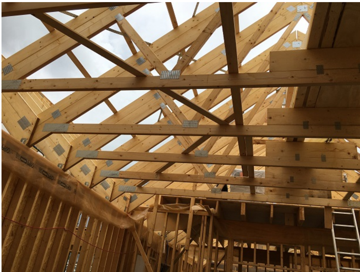
Tagspær på Børnehuset Gyldensten.