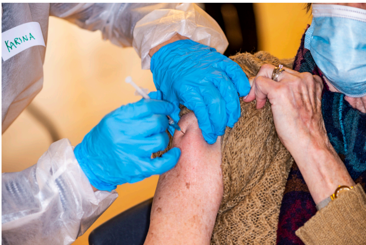
Vaccination gives i arm.