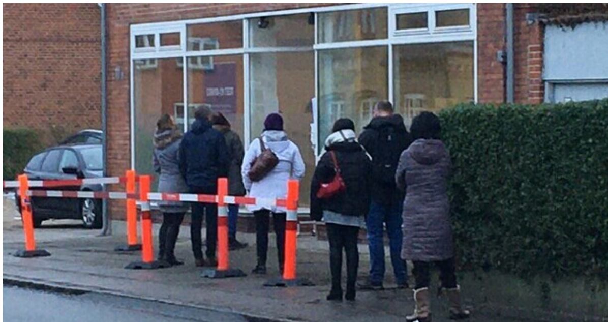
Kø ved testcenteret på Lundevej i Frederikssund.

Genåbningen af samfundet kan aflæses direkte i antallet af nye smittede med Covid-19. I Frederikssund Kommune er der konstateret 57 nye smittede på en uge. Der er dog stadig langt til risiko for nedlukning af kommunen. Læs ugens coronastatus her .