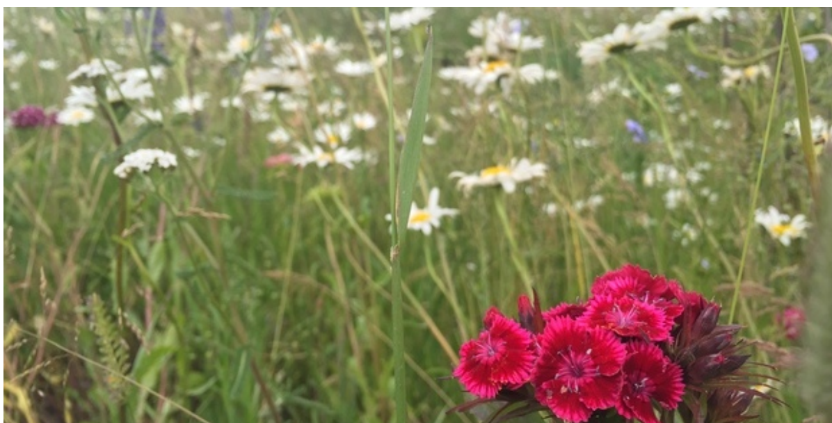
Vilde blomster i vejgrøft i Vinge.

Frederikssund Kommune tilmelder sig nu den landsdækkende konkurrence "Danmarks vildeste kommune" udkrevet af Miljøministeriet. Det blev besluttet på byrådsmødet onsdag den 28. april.