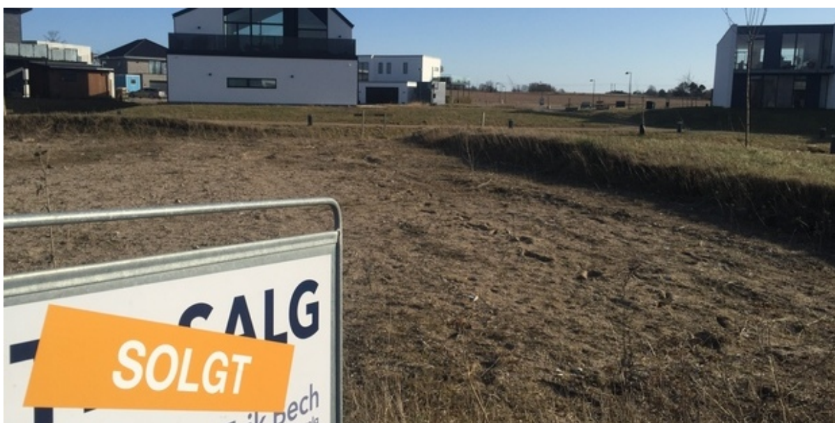
Tom byggegrund med solgt-skilt i forgrunden.

De sidste byggegrunde til parcelhuse i Deltakvarteret er nu solgt. En af køberne valgte grunden i Vinge af mange årsager, men især nærheden til S-toget lokkede.