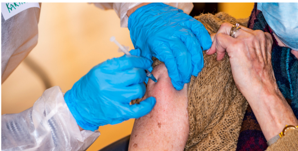
Vaccination gives i arm.

Frederikssund Kommune og Region Hovedstaden planlægger sammen med praktiserende læger en forstærket vaccinationsindsats, der i første omgang kommer til at bestå af en fremskudt vaccination i Frederikssundhallen den 15. april, hvor op imod 150 af de ældste og mest sårbare borgere i målgruppe 2, 3 og 7 bliver vaccineret. Derudover kommer flere af kommunens praktiserende læger til at vaccinere i deres klinik i næste uge.