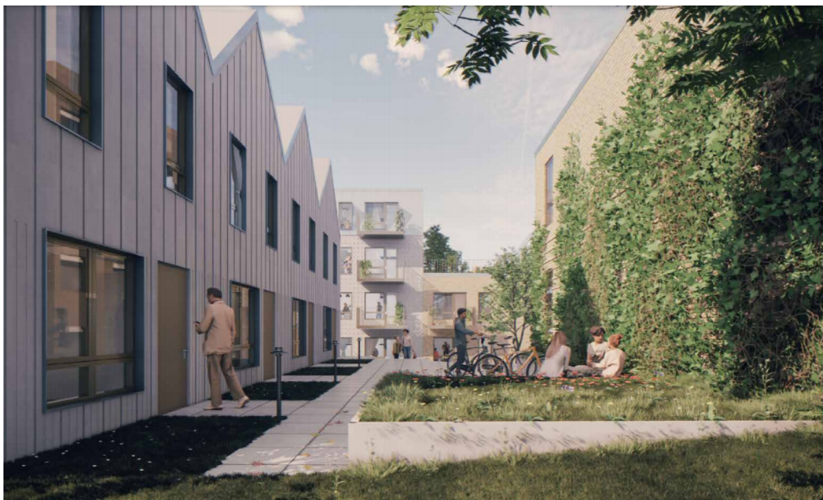
Visualisering af almene boliger i Vinge. Visualisering: Mangor og Nagel.

På Byrådets møde den 24. marts blev den endelige godkendelse givet til 198 almene boliger i Vinge. Byggeriet kan dermed begynde efter påske.