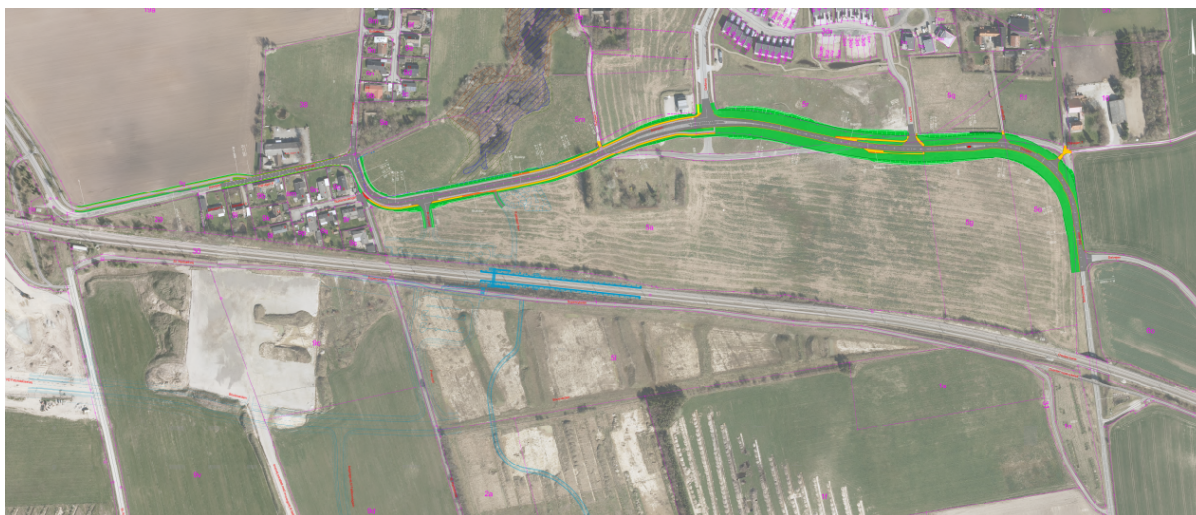
Kort der viser Dalvejens fremtidige forløb. Grafik: Frederikssund Kommune.

Byrådet har i januar bevilget 9,8 mio. kr. til forbedringer af Dalvejen i Vinge. Vejen bliver bredere, de skarpe sving bliver blødere og vejen bliver omlagt op mod Deltavej.