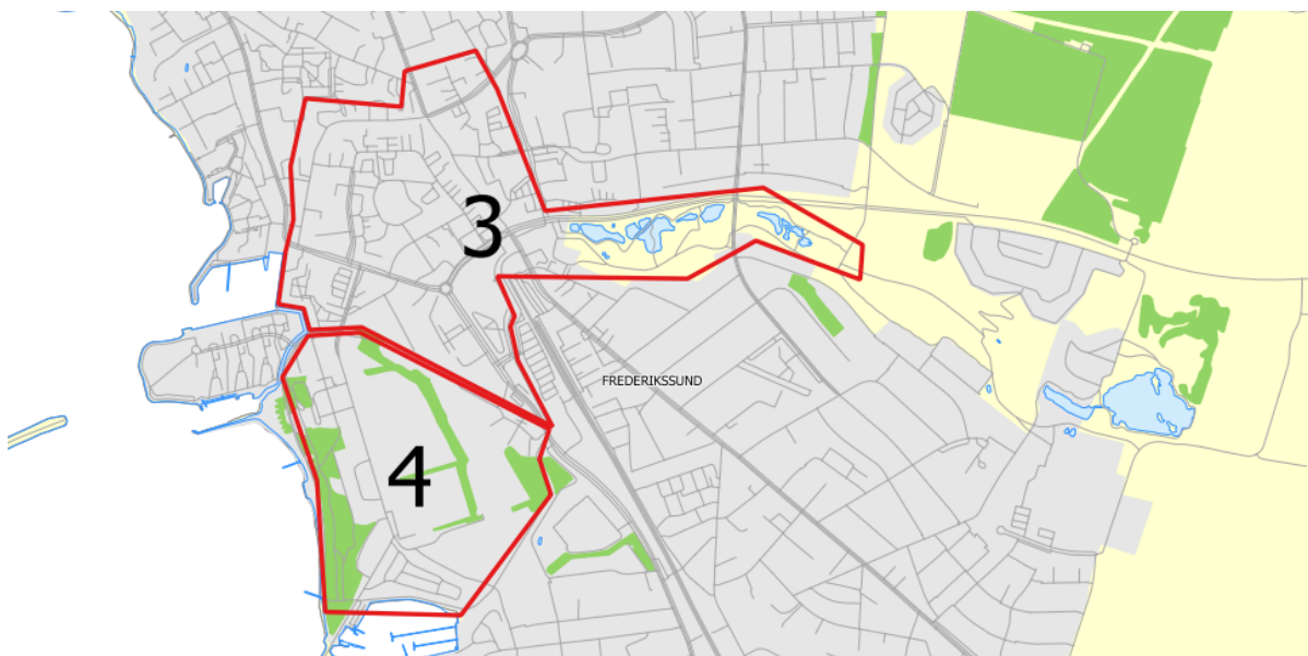
Kort, der viser afgrænsningen af kystbeskyttelsesprojektet. Grafik: Frederikssund Kommune.

Hvordan skal Frederikssund midtby sikres mod oversvømmelse? Og hvordan kan denne sikring blive en aktiv og brugbar del af byrummet? Det er nogle af de ting, som Frederikssund Kommune gerne vil høre dit bud på, når vi holder picnic og går en tur i byen tirsdag den 21. juni.