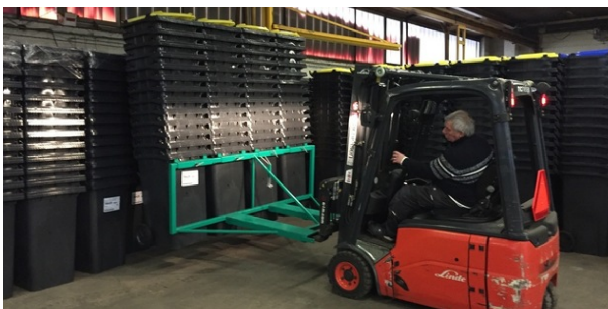
Truck sætter affaldsbeholdere i stakke på lageret i Jægerspris.

Nu begynder leveringen af de nye affaldsbeholdere, som alle husstande i Frederikssund Kommune får. De nye beholdere er et led i Regeringens strømning af sortering og genbrug af affald i Danmark.