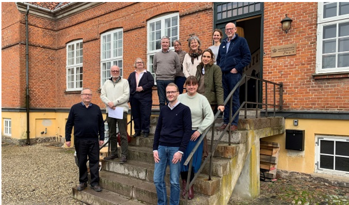
Bestyrelsen for Selsø Slot, januar 2022.

27. januar mødtes den nye bestyrelse for Den Plessenske Selsø Fond, som dagligt driver Herregårdsmuseet Selsø Slot.