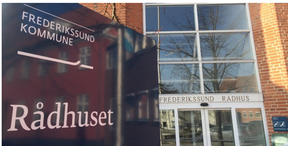
Rådhusets hovedindgang.

Frederikssund kommune har netop indgået et samarbejde med den frivillige forening Medusa, der skal forebygge og afhjælpe partnervold.