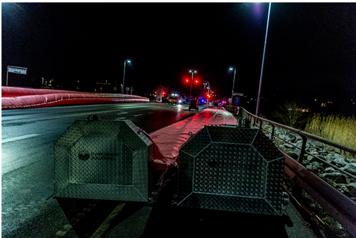
Watertubes er klar til fyldning med vand.

Der bliver arbejdet på højtryk overalt i kommunen for at blive klar til storm og høj vandstand på søndag.