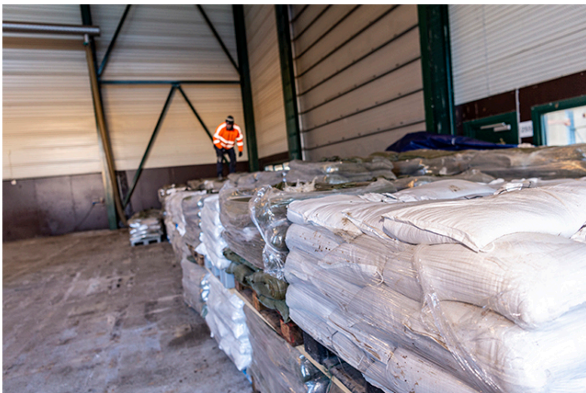
Depot af Sandsække hos Vej og Park.