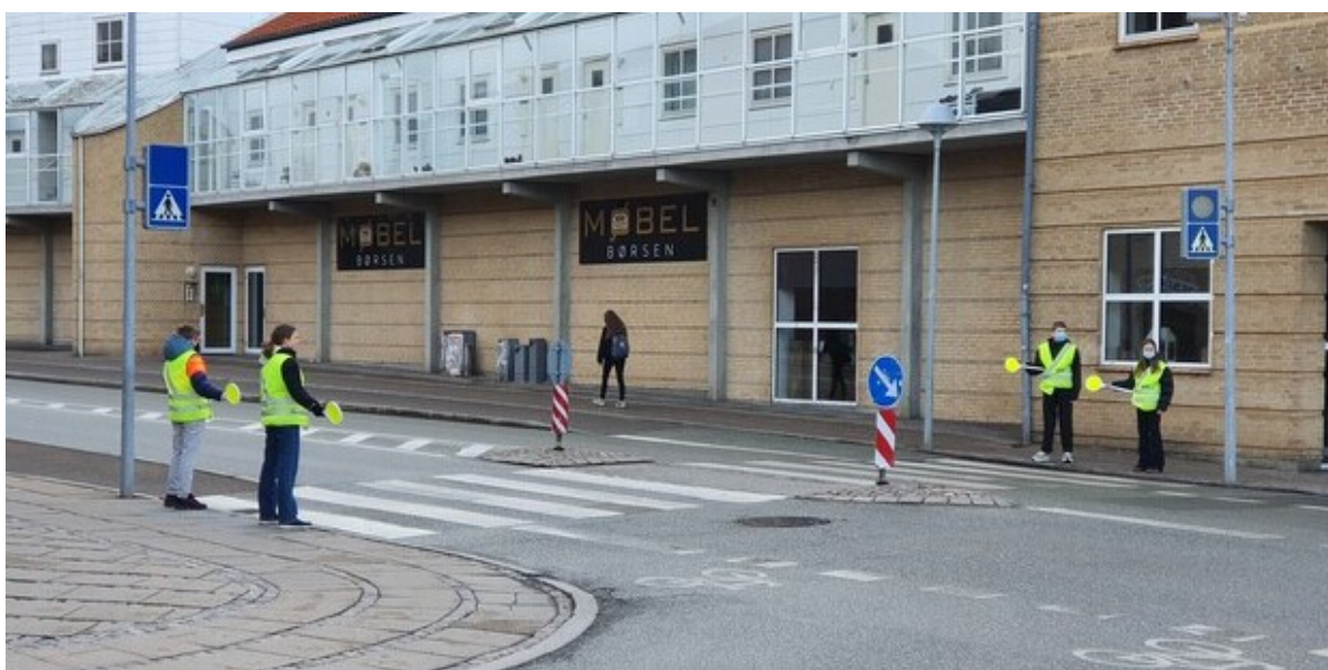
Skolepatruljer på arbejde ved Frederikssund Private Realskole.

I uge 5 er vejret altid lidt surt. Derfor overrasker Nordsjællands Politi og de nordsjællandske kommuner i de kommende dage skolepatruljerne for at anerkende deres store indsats.