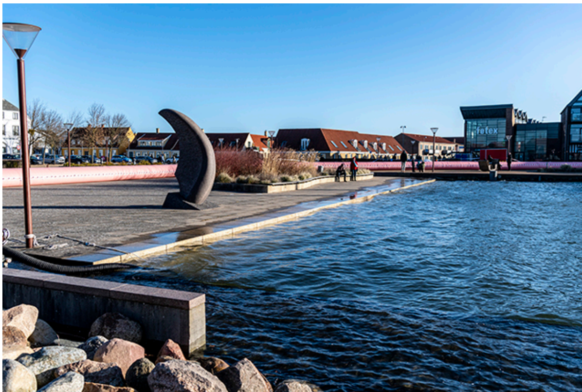
Frederikssund Havn med højvande og watertubes på havnefronten.

frem, der kan skabe synergi mellem kystbeskyttelsen og bylivet.