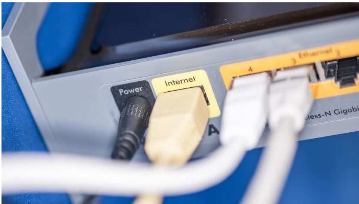
Netværkskabel tilsluttet pc.

Bredbåndspuljen er åben for ansøgninger. Og hvis du ikke nåede at komme til et af infomøderne om puljen, så holdes der nu et online møde den 29. juni.