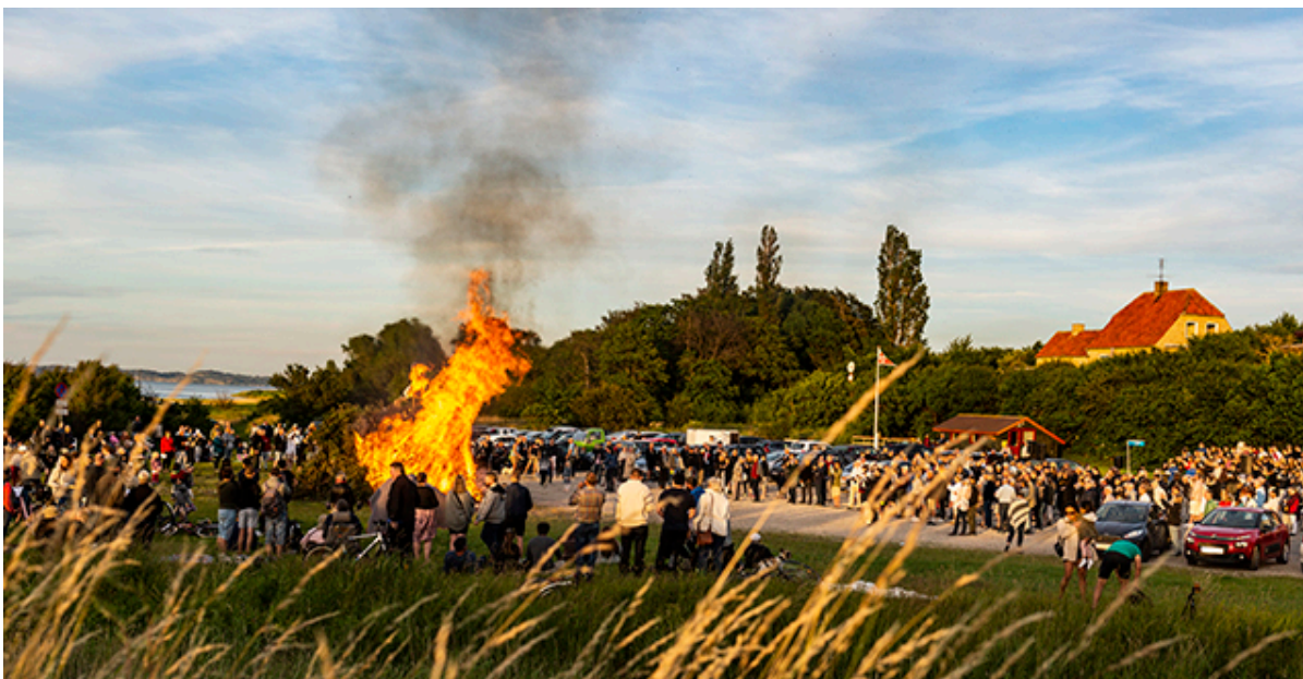
Sankhansbål på Kulhuse Havn i 2019.

De sidste par år har Corona sat en stopper for den traditionelle fejring af midsommeren med afbrænding af sankthansbål. Men i år er der flere bål i sigte.