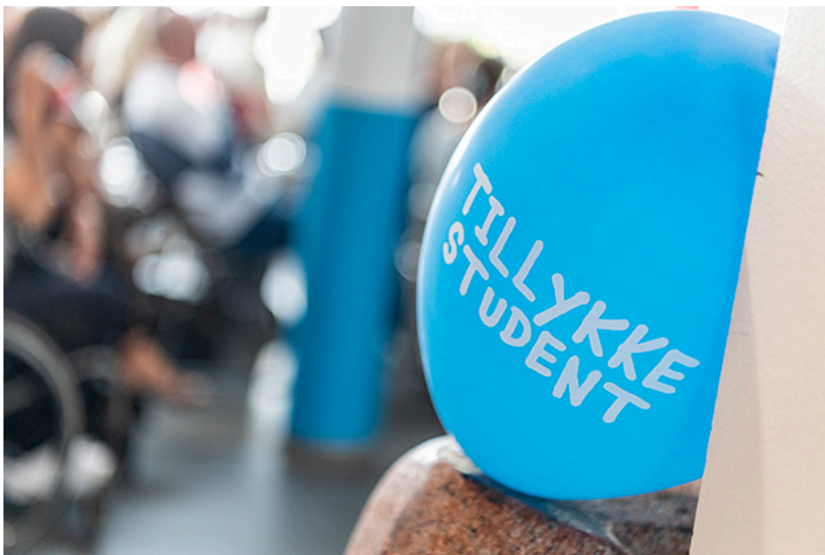
Blå studenterballon.