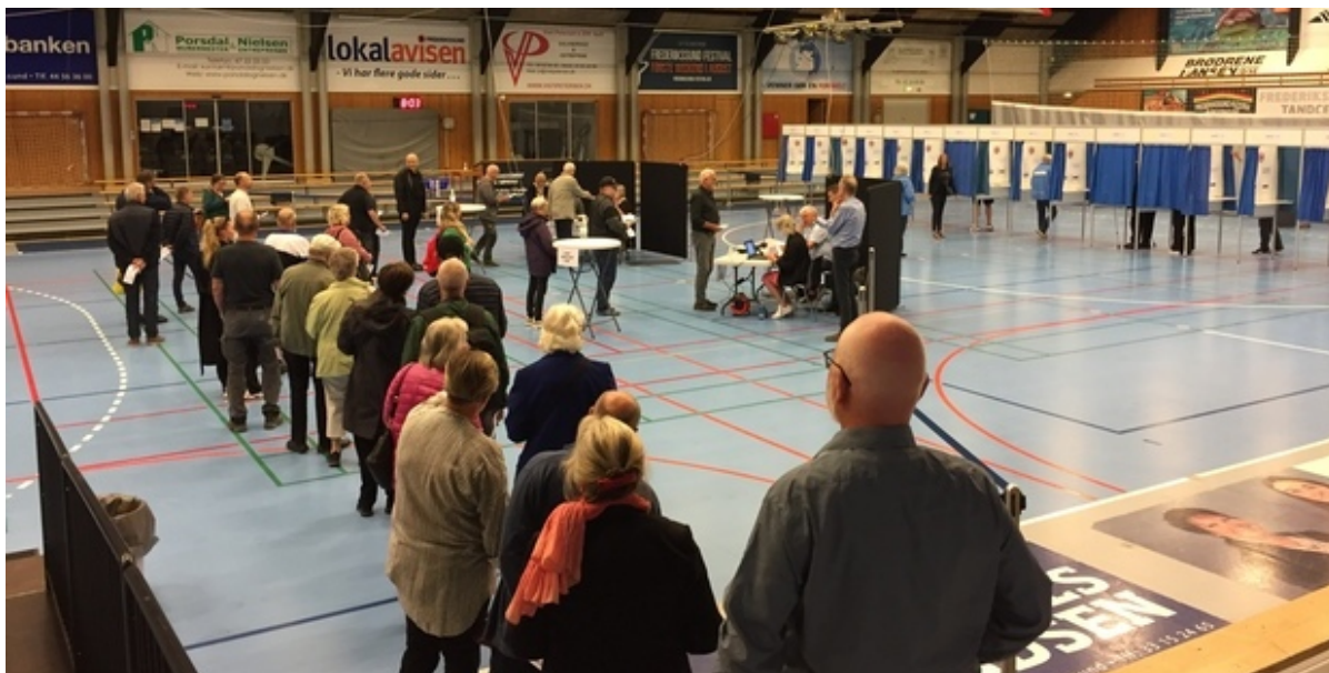
Vælgere i Frederikssundhallen.

Den 1. juni er der folkeafstemning i Danmark om forsvarsforbeholdet. Valgstederne er åbne fra kl. 8.00 til kl. 20.00 i aften.