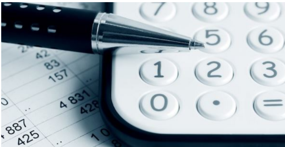
Lommeregner, kuglepen og papirer med tal.