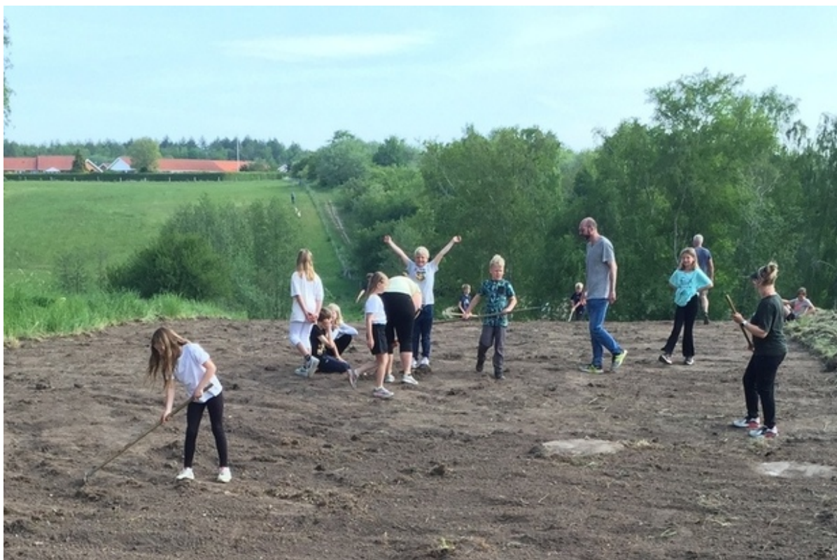
Børn fra 3. klasse arbejder med haveredskaber.

Stokroser, solsikker og blomster i massevis. På Ådalens Skole i Frederikssund skaber børnene i 3. klasse øget biodiversitet i skolens Bio-Lab.