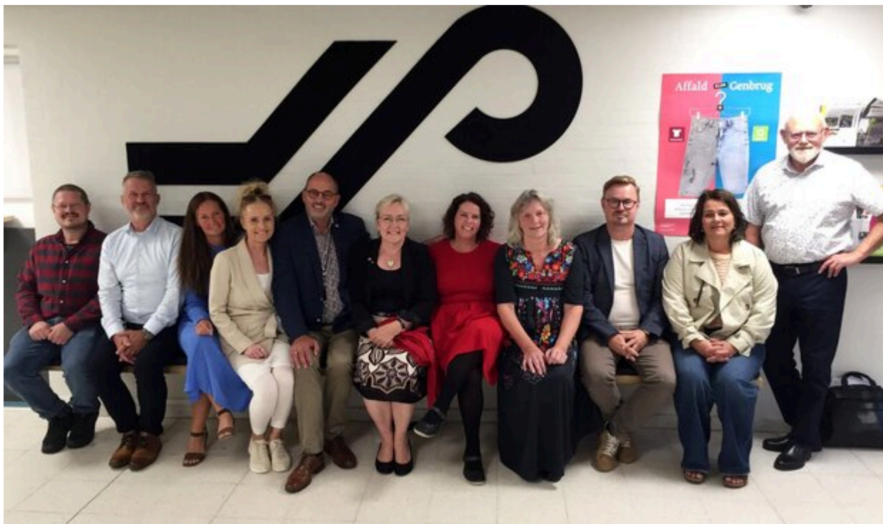
Borgmester og gruppeformænd i rådhusets forhal.