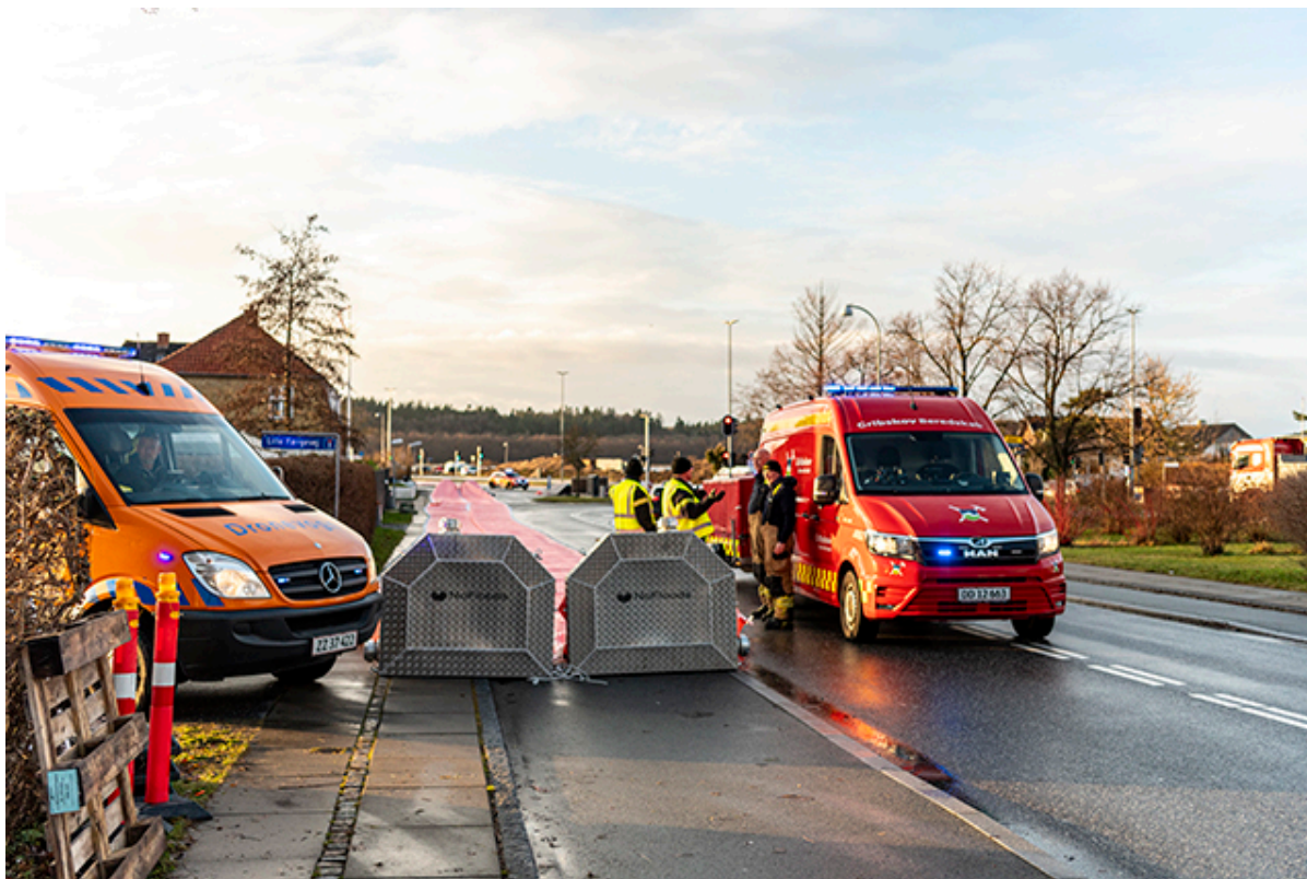
Watertube på Færgevej i Frederikssund.

Onsdag den 20. december udlagde beredskabet watertubes en række steder i Frederikssund Kommune. Arbejdet fortsætter torsdag den 21. december med at fylde dem op med vand.