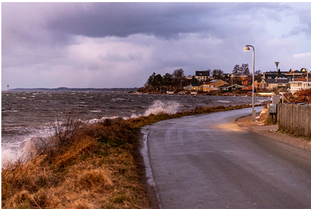
Strandvej i Frederikssund med vandet piskende ind over.

Novafos tager nu forholdsregler for at forhindre opstuvning af regnvand i Frederikssund midtby. Samtidig sættes der spærring på Sillebro Å.