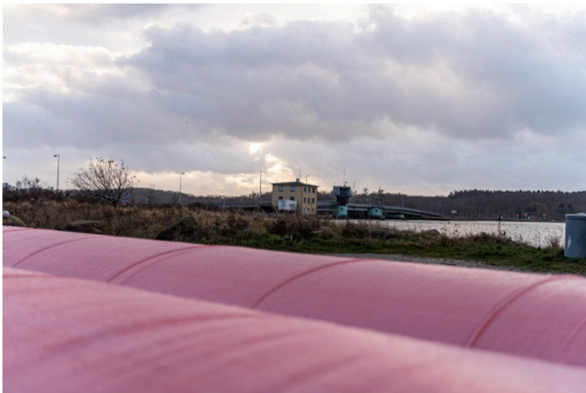
Udsigt over fjorden over en watertube.