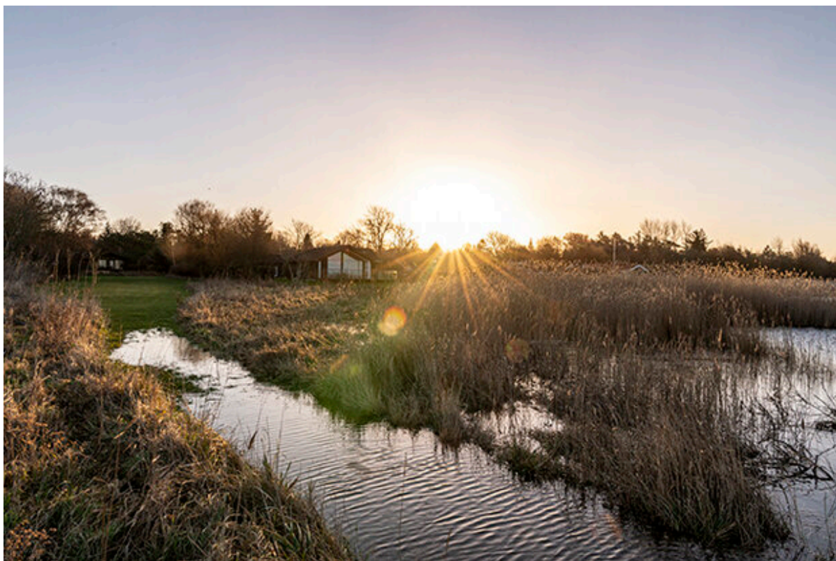
Arkivfoto. Højvande ved Over Dråby Strand 2022.

Radius meddeler, at der kan være risiko for strømafbrydelser i mindre områder, hvis vandstanden bliver for høj. Torsdag formiddag er et antal husstande i Over Dråby Strand uden strøm.