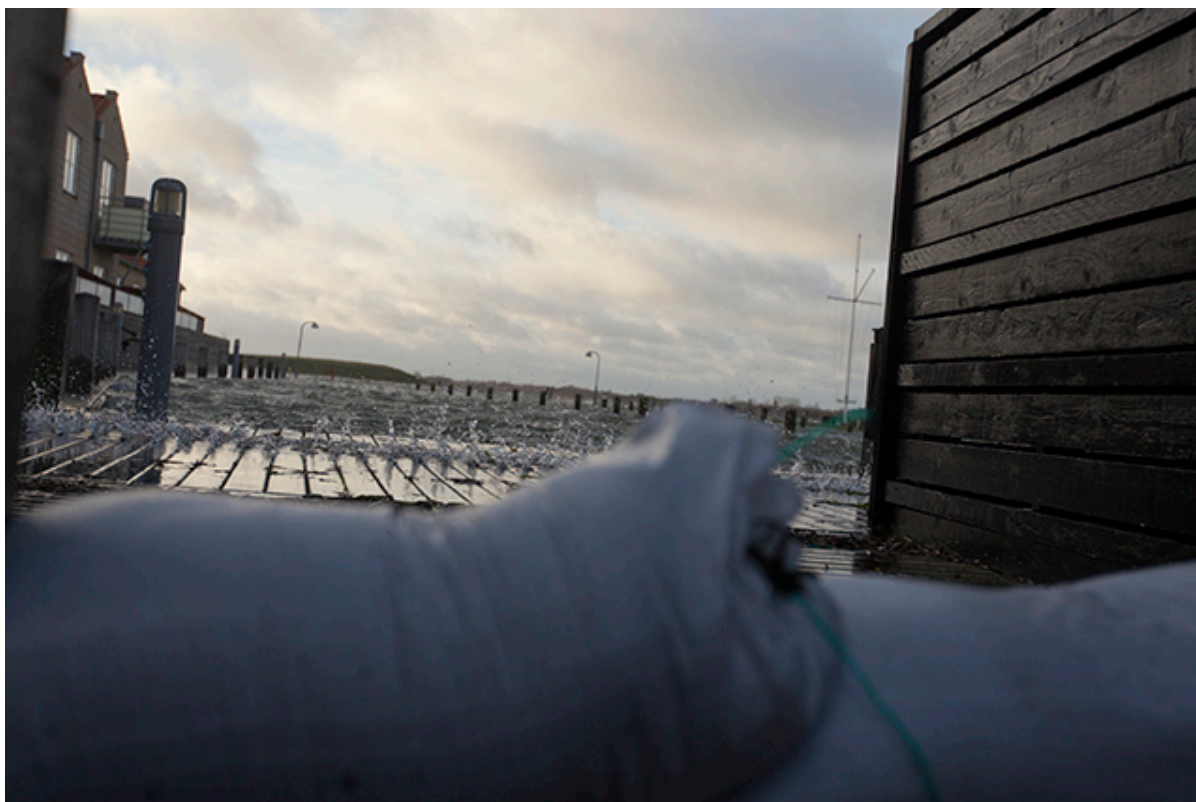
Vandet stod højt i Skyllebakke Havn i januar 2022.

Fra torsdag morgen får udsatte ejendomme besøg af informationsmedarbejdere fra kommunen.