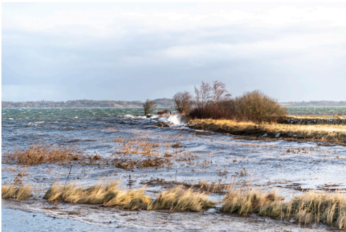
Højvande ved Kulhuse, Revelinen.