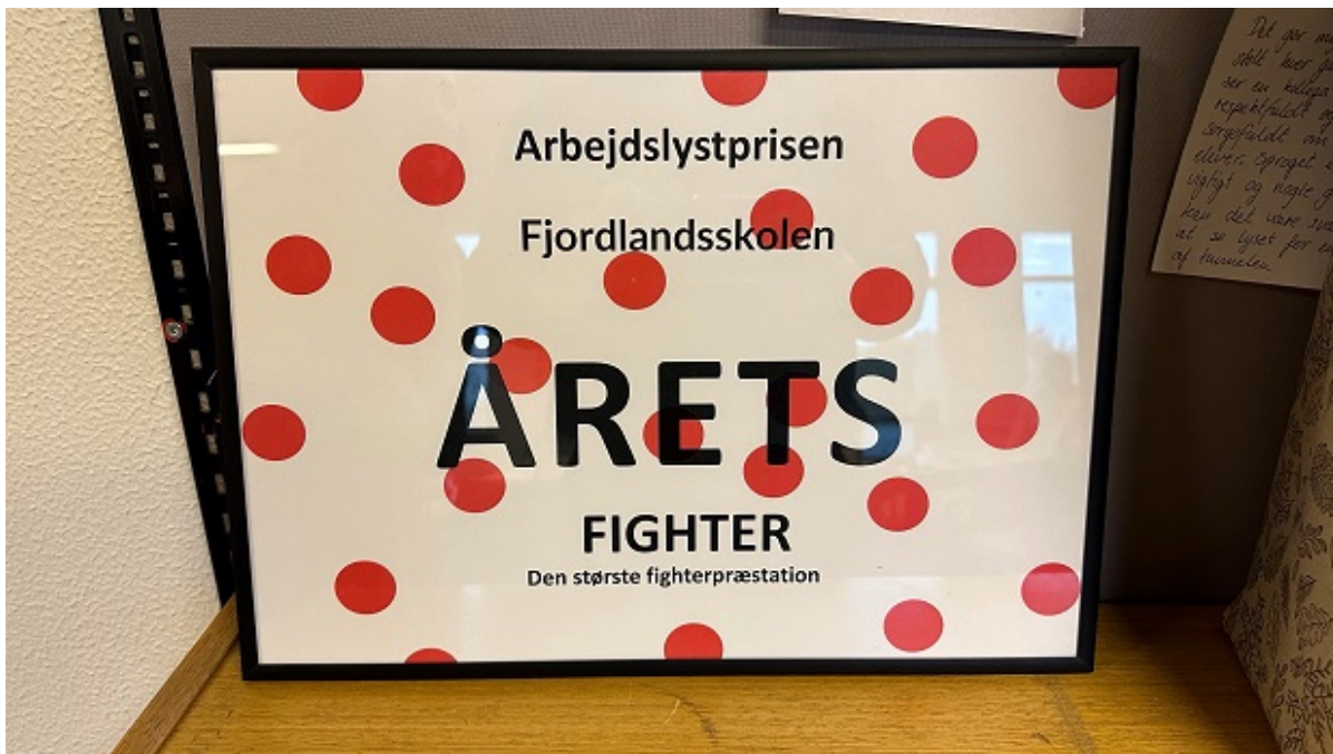
Diplom for prisen som Årets Fighter.