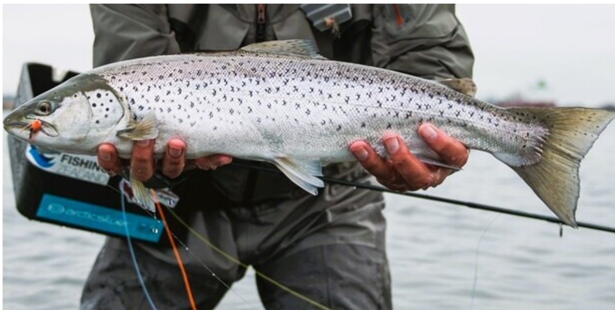
Lystfisker fremviser en stor havørred.

Fishing Zealand og Frederikssund kommune inviterer til en hyggelig dag langs kysterne i Fjordlandet søndag den 11. december, hvor dagen afsluttes med hygge ved bålet.