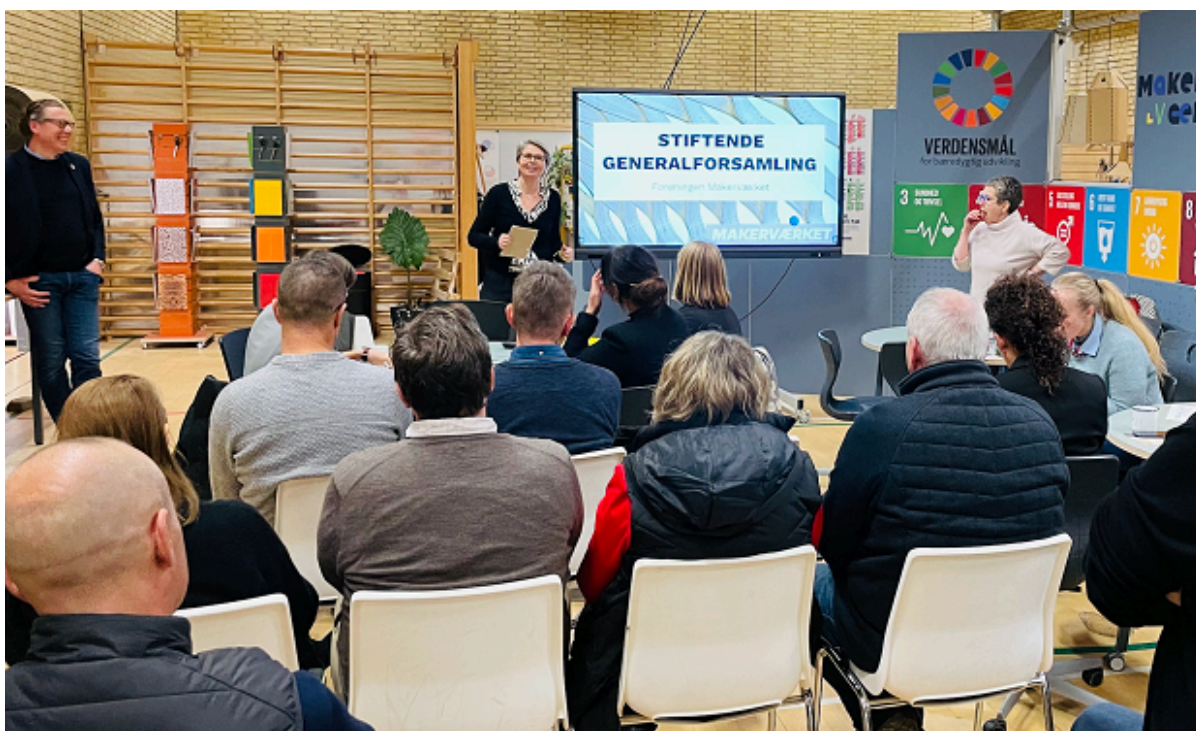
Stiftende generalforsamling for Forening MakerVærket.

Den gamle gymnastiksal på gymnasiet summede af liv, gløgg og æbleskiver, da den nye Forening MakerVærket blev stiftet ved den stiftende generalforsamling torsdag d. 8. december.