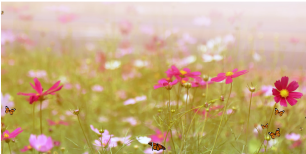
Blomstrende eng med hvide og lyserøde blomster.

Som et led i kommunens strategi for at fremme biodiversiteten er projekt Blomster i Byen søsat. Projektet vil løbe over flere år, hvor forskellige tiltag vil øge mængden af blomster i byerne til gavn for plante- og dyrelivet.