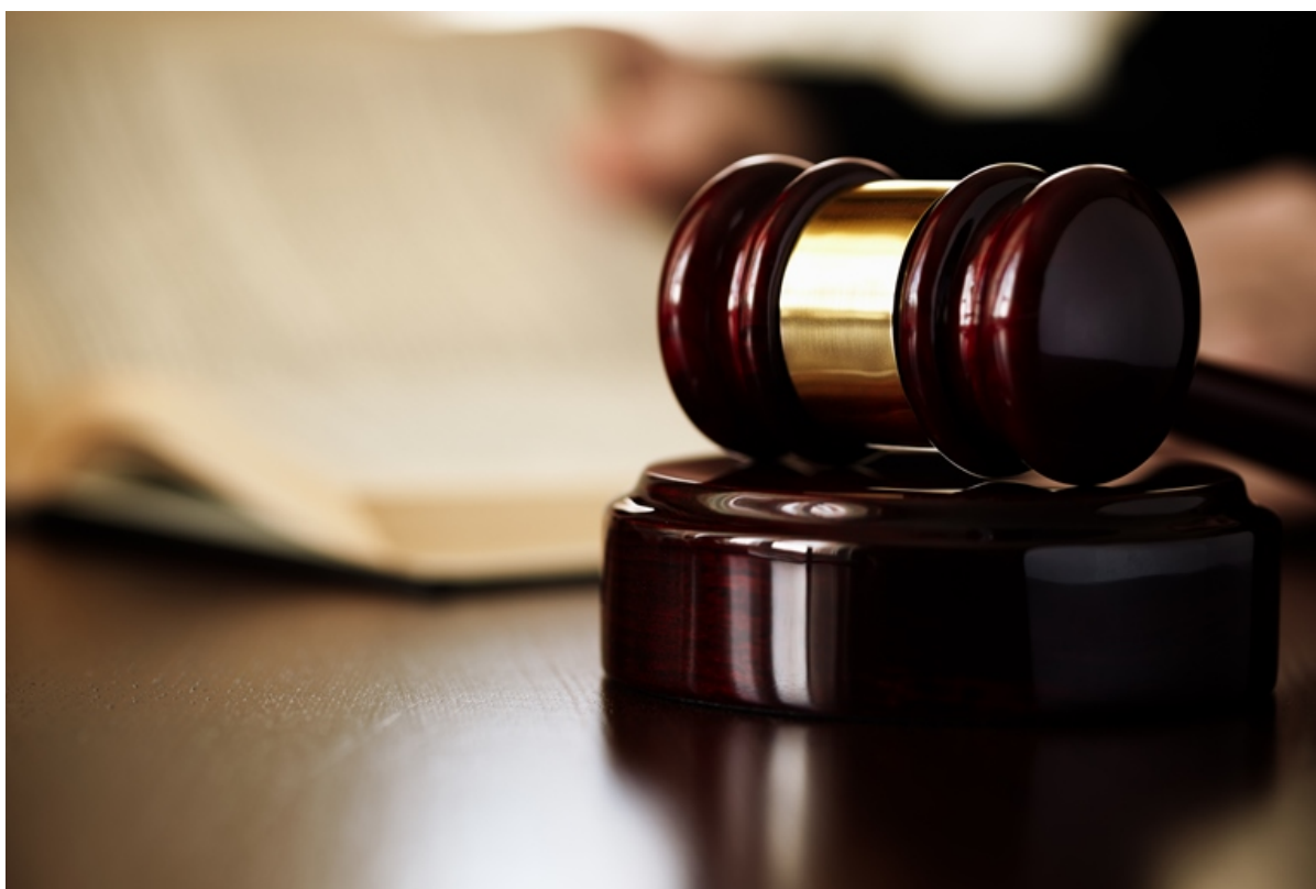
Dommerhammer ligger på et bord.

Har du lyst til at være en del af det danske retssystem som nævning eller domsmand? Så har du nu muligheden for at ansøge om plads på grundlisten, hvorfra der udvælges, hvem der skal være nævning eller domsmand ved en retssag.