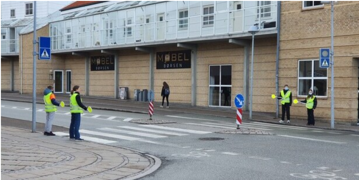
Skolepatruljer på arbejde ved Frederikssund Private Realskole.

I uge 5 er vejret altid lidt surt. Derfor overrasker Nordsjællands Politi og de nordsjællandske kommuner i de kommende dage skolepatruljerne for at anerkende deres store indsats.