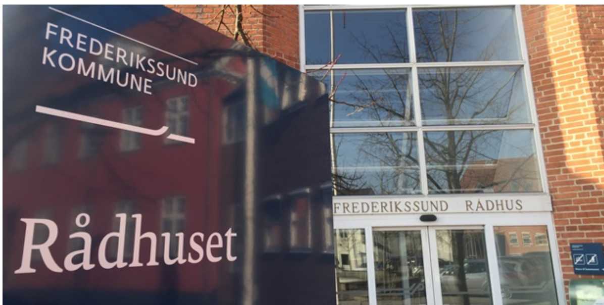
Rådhusets hovedindgang.