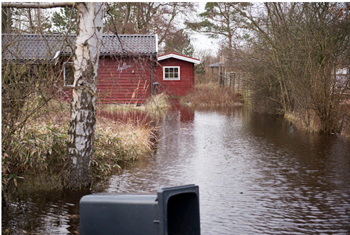
Goldbjergvej i Kulhuse under stormen Egon i januar 2015.