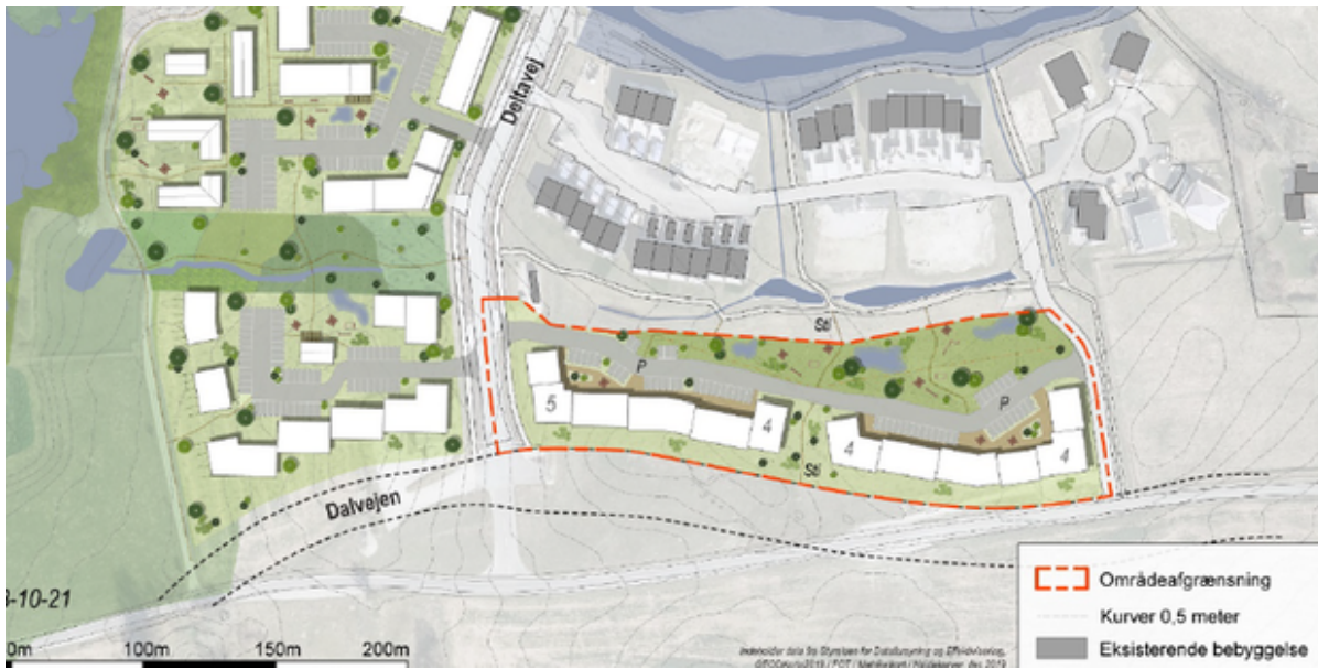
Kortudsnit, der viser den kommende lokalplans afgrænsning. Grafik: Frederikssund Kommune.