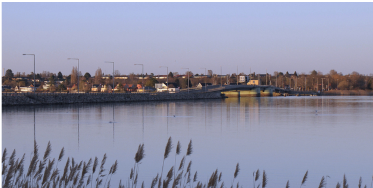
Kronprins Frederiks Bro.

På byrådsmødet den 26. januar blev det besluttet at skrive til transportministeren med en opfordring til at fastholde et forbud mod lastbilkørsel på Kronprins Frederiks Bro.