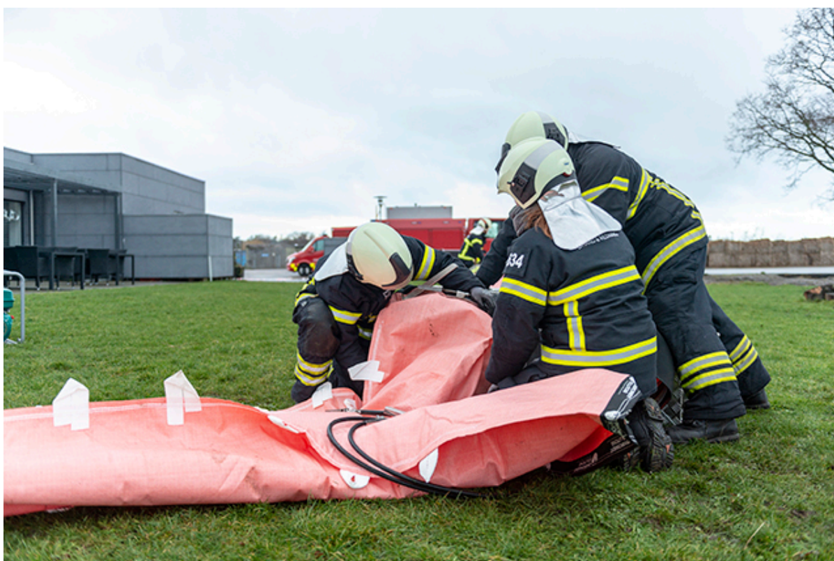
Beredskabet lægger watertube ud i Jægerspris ved Kignæshallen.

DMI varsler en forventet vandstand på 159 cm over dagligt vande søndag den 30. januar 2022. Krisestaben har derfor besluttet at iværksætte forhøjet beredskab.