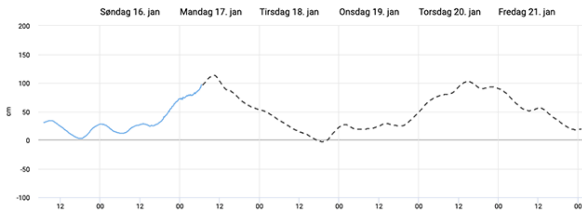
DMI's varsel for vandstand ved Kignæs i Roskilde Fjord 17. januar 2022.

DMI's prognoser for vandstand i både Roskilde Fjord og Isefjord giver mandag morgen ikke anledning til øget beredskab.