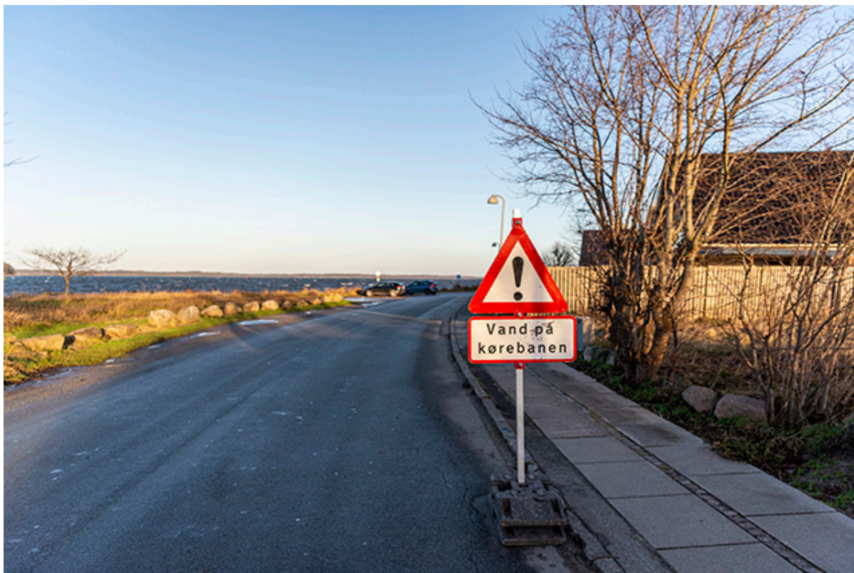
Skiltning om vand på kørebanen.