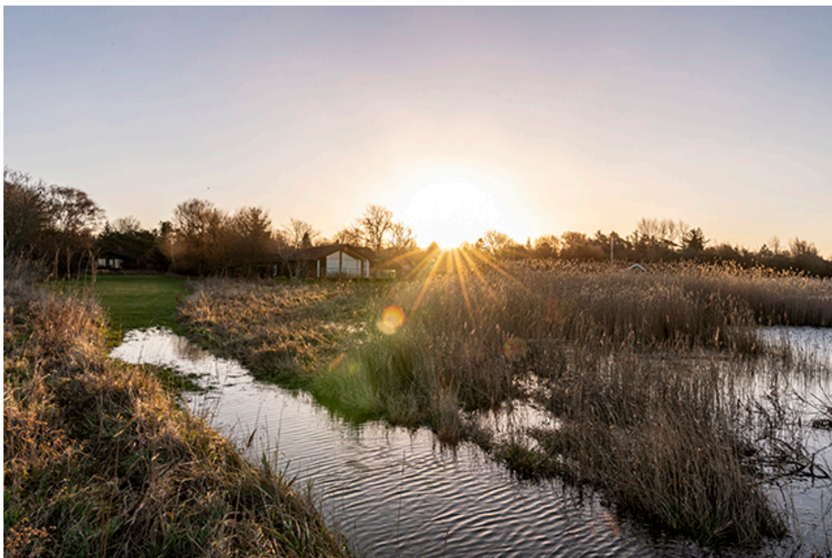
Over Dra by Strand var stedet hvor vandet kom tættest på .

Mandag eftermiddag er vinden ved at lægge sig og vandstanden er også faldenden igen - og som ventet uden at nå et kritisk niveau.