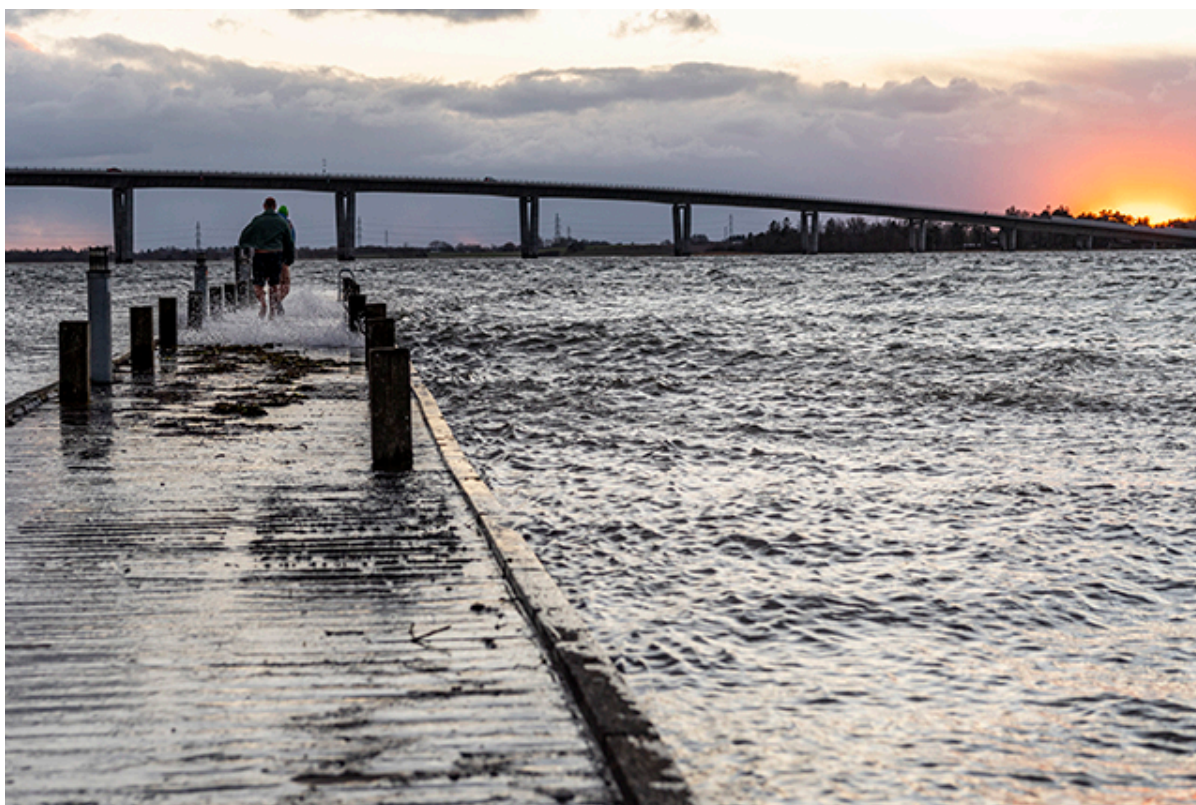
Vinterbadere trodser storm og højvande.