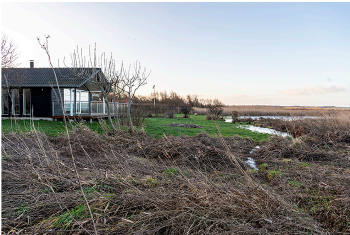
Ikke mange meter igen på over Dra be Strand.

DMI varsler torsdag morgen lidt mere vand i fjordene end først forventet. Det kan påvirke en række ejendomme langs fjorden.