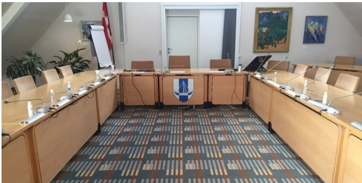
Byrådssalen med Dannebrog i baggrunden.

Januar måneds byrådsmøde begynder tidligere end normalt. Så hvis du vil følge med i mødet i byrådssalen eller online, så skal du være klar kl. 16.