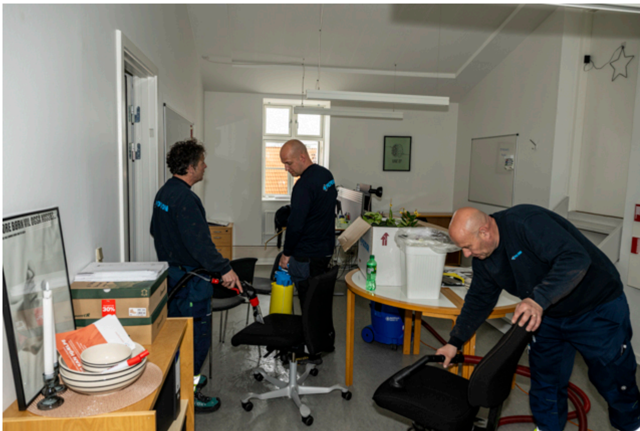
Medarbejdere fra Polygon i gang med at rengøre kontorer på Ra dhuset.