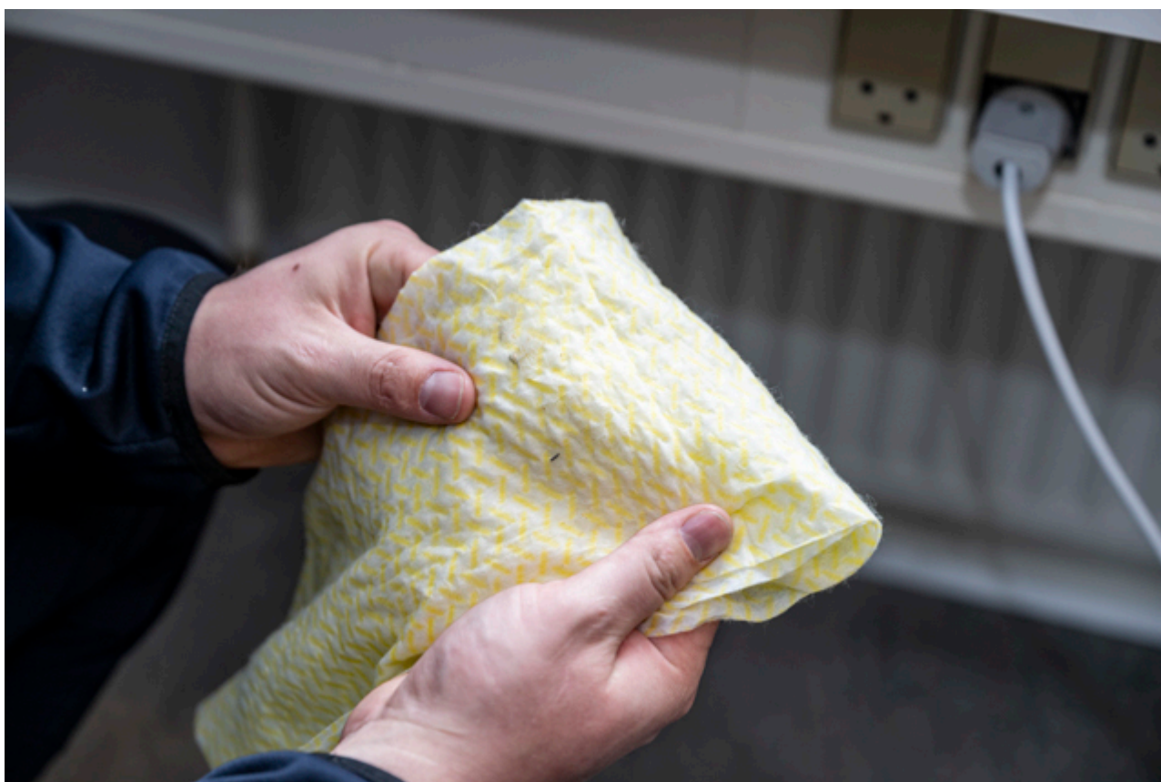
Alle flader rengøres flere gange, og testes med specielle olieklude, som afslører, om der fortsat er sod, som kræver endnu en rengøring.