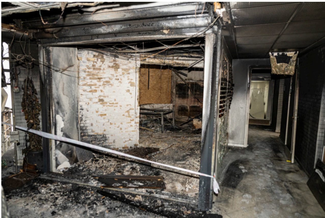
Stueetagen og arnestedet for branden er helt ødelagt af flammerne.