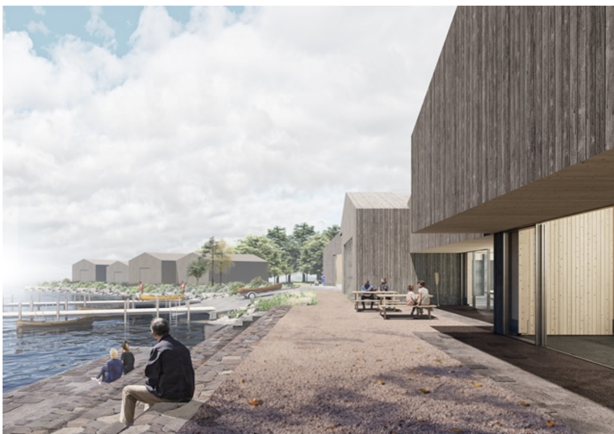
Illustration af foreningsplads foran Maritimt Center Frederikssund. Illustration: Tegnestuen DETBLÅ.

Byrådet har godkendt en visionsplan for Maritimt Center Frederikssund. Visionsplanen er en samlet plan for udviklingen af Frederikssund Lystbådehavn og består af et basisprojekt og et visionsprojekt.