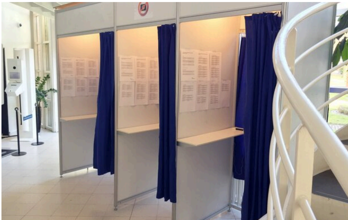
Tre stemmebokse i Borgercenteret er klar til at modtage vælgere, der ønsker at brevstemme.